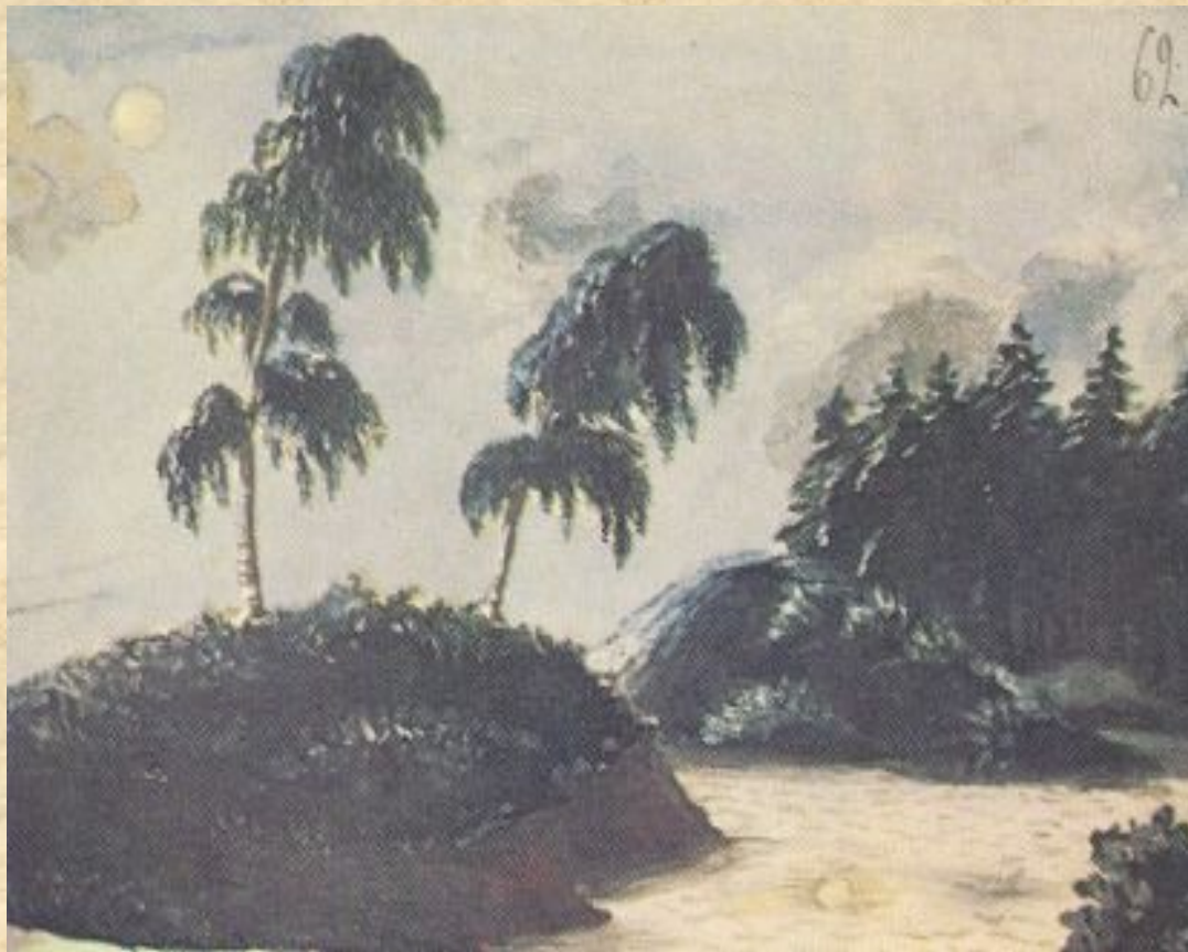
69 Тейзаж с двумя березами. Акварель. 1828—1832 г.