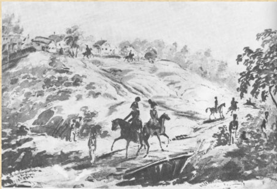
Эпизод из маневров в Красном Селе. Сепия. (Утрачена в 1941 году) 1834—35 г.