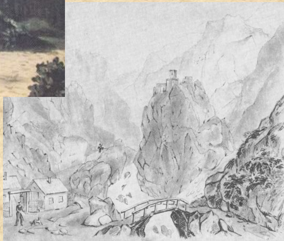
Дарьяльское ущелье с замком царицы Тамары. Карандаш. 1837 г