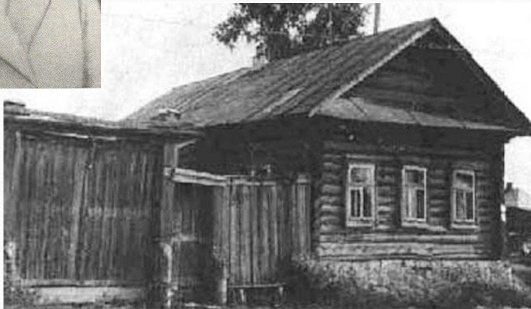
Последнее место жизни М. И.Цветаевой