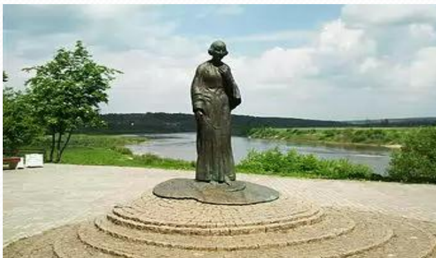
Памятник Марине Цветаевой в Тарусе