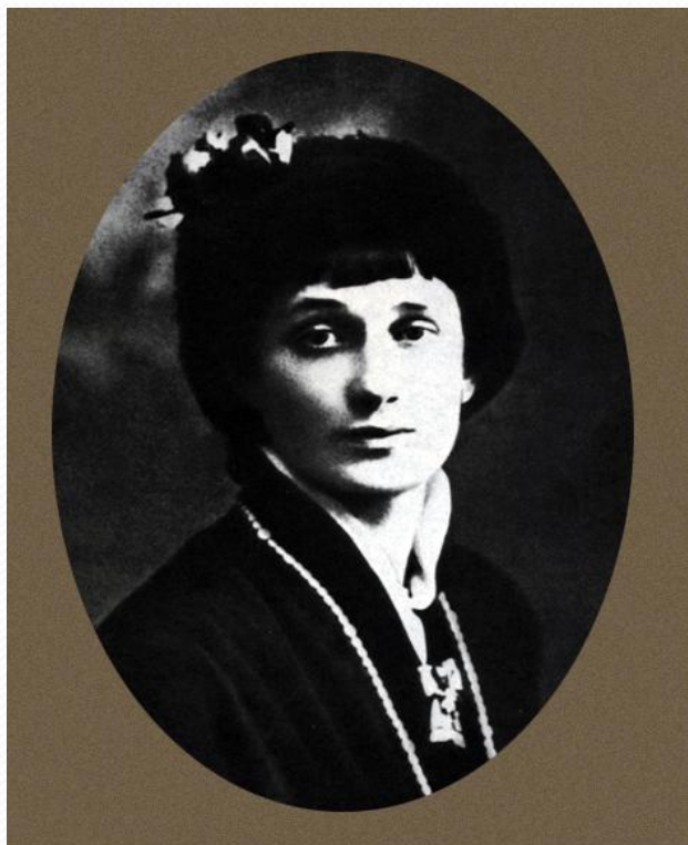
Цветаева и Ахматова

О, Муза плача, прекраснейшая из муз! О ты, шальное исчадие ночи белой! Ты черную насылаешь метель на Русь, И вопли твои вонзаются в нас, как стрелы.