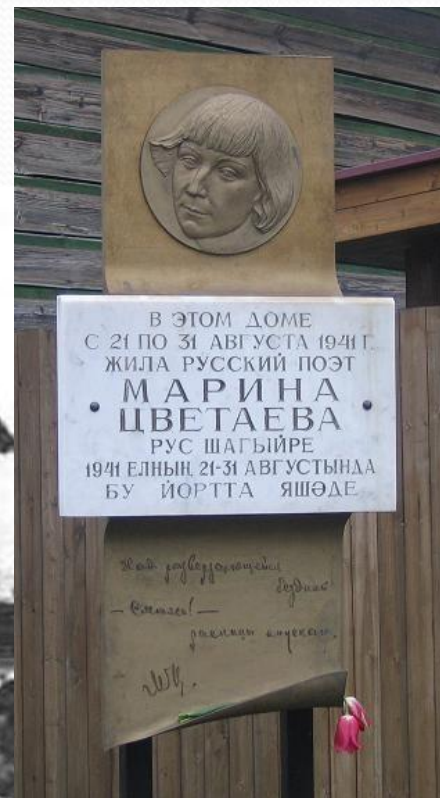
Последнее место жизни М. И.Цветаевой