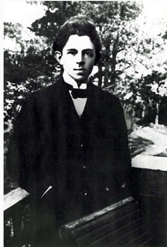
Цветаева и Осип Мандельштам