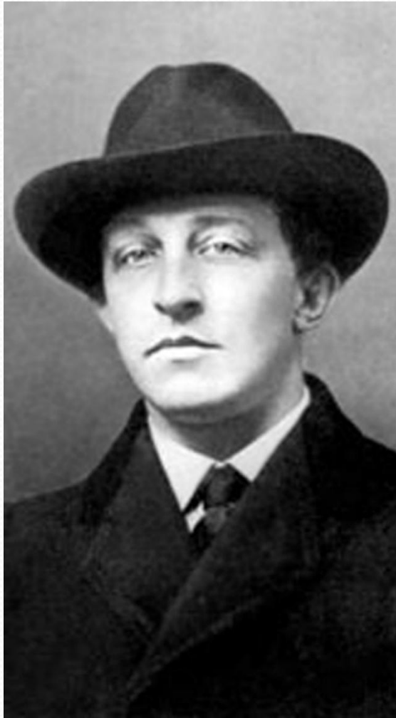
Цветаева и Блок

Имя твое -- птица в руке, Имя твое -- льдинка на языке, Одно единственное движение губ, Имя твое -- пять букв. Мячик, пойманный на лету, Серебряный бубенец во рту,