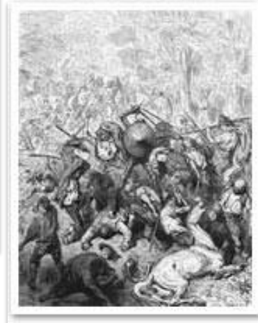
Ілюстрація до «Дон Кіхота» Жана Гранвіля 1848