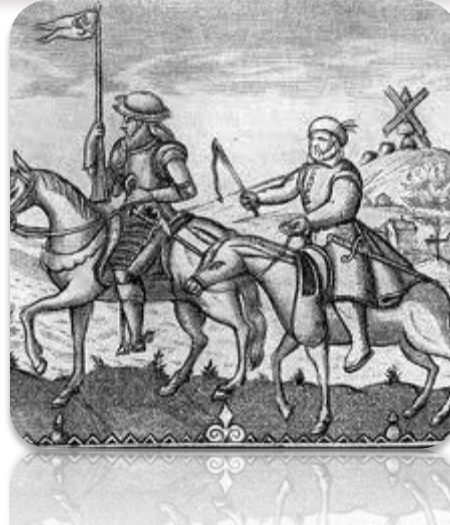
Дон-Кіхот і Санчо Панса Гравюра з титульного листа одного з перших видань