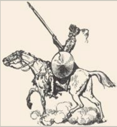
Оноре Домье Дон Кихот Ок. 1868 г. Мюнхен