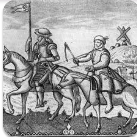
Дон-Кіхот і Санчо Панса Гравюра з титульного листа одного з перших видань