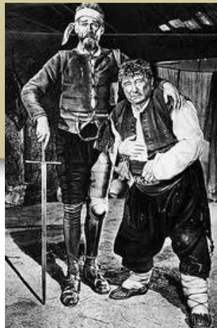
Н. Черкасов і Ю. Толубєєв у фільмі «Дон Кіхот»