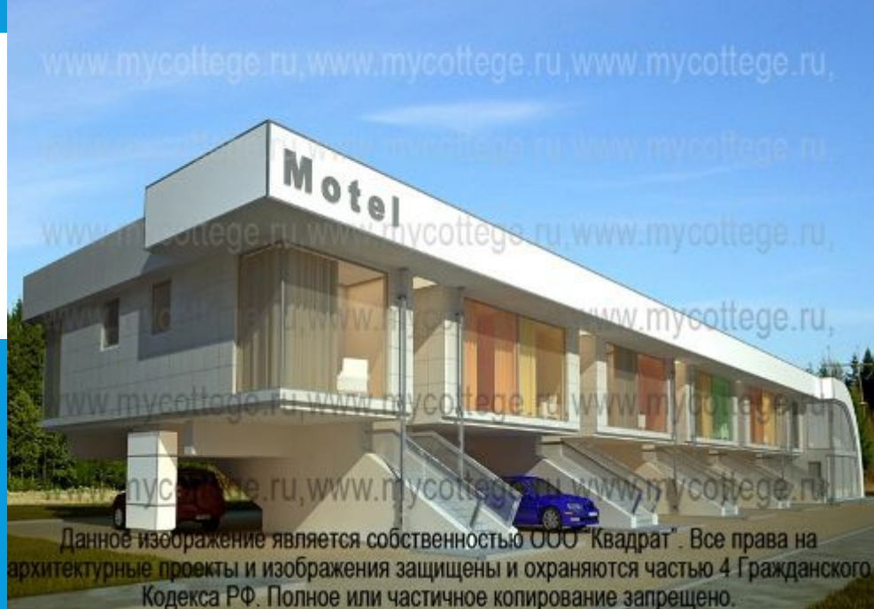
Данное изображение является собственностью ООО "Квадрат". Все права на архитектурные проекты и изображения защищены и охраняются частью 4 Гражданского Кодекса РФ. Полное или частичное копирование запрещено.