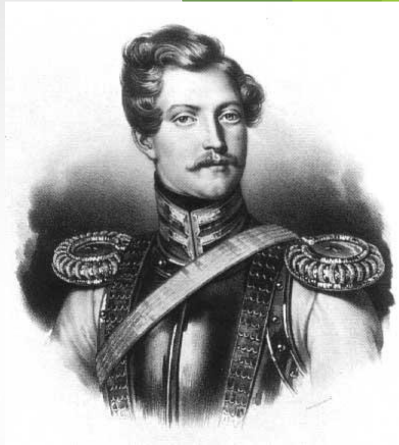
Бенар с оригинала неизвестного художника Ж. Дантес-Геккерн. 1830-е гг

В 1835 году появился повод к дуэли, когда молодой офицер Дантес начал ухаживать за Натальей Николаевной, чему она была не против.