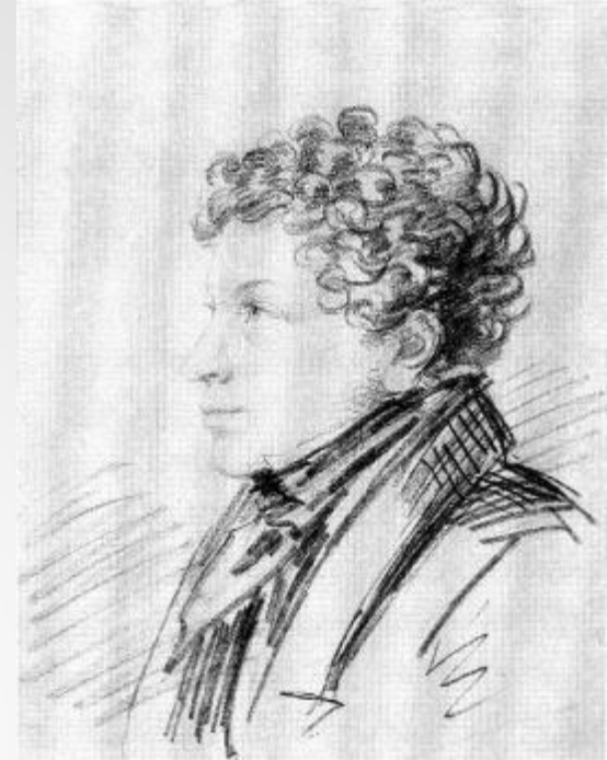
А.О. Орловский Л.С. Пушкин. Первая половина 1820-х гг.

Любовь ему компенсировала знаменитая няня Арина Родионовна