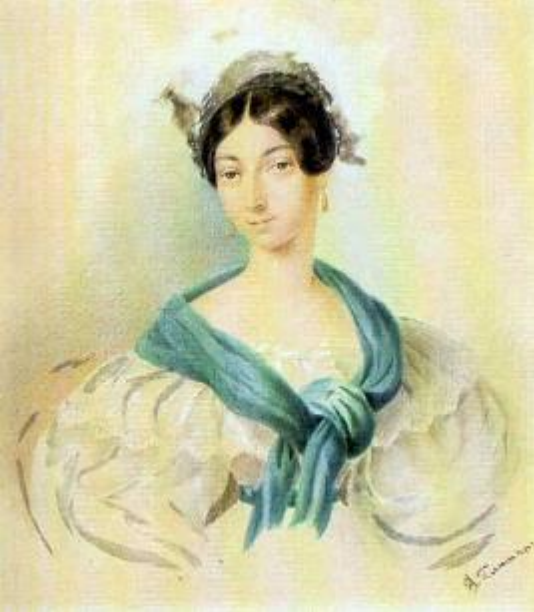
Е.А. Плюшар О.С. Павлицева. Середина 1830-х гг.

Кроме Александра у Пушкиных были дети - старшая дочь Ольга и младший сын Лев.