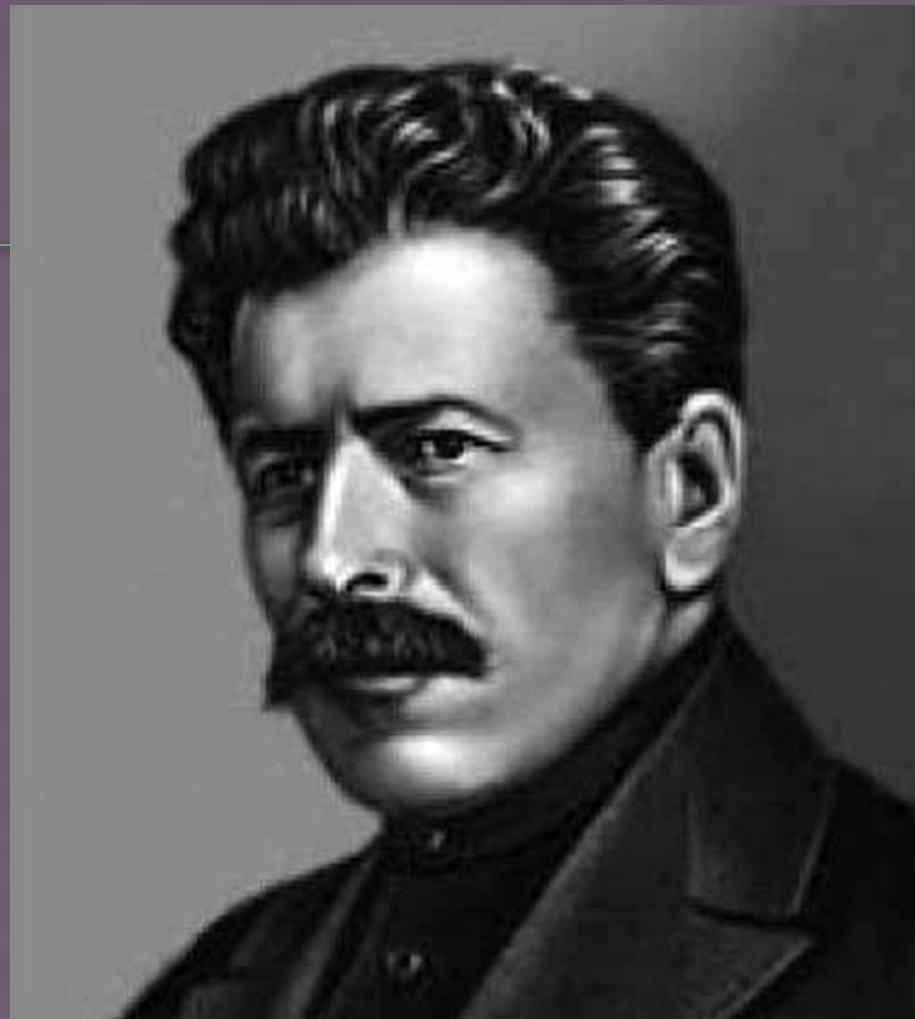
М.Б. Греков ( до 1911 г. Мартищенко Митрофан Павлович)

Митрофан Борисович Греков- выдающийся советский художник- баталист. Он сыграл заметную роль в развитии отечественного искусства. Будучи приверженцем реалистических традиций русской живописной школы XIX века он был пропагандистом зарождающегося официального стиля эпохи - социалистического реализма