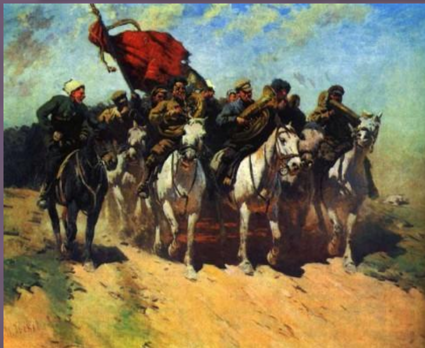
«Трубачи Первой Конной»