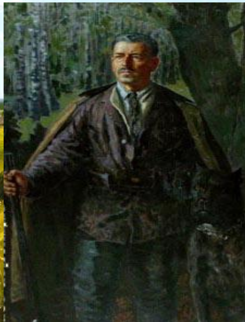
Портрет М.Б. Грекова работы художника Г.Н. Горелова