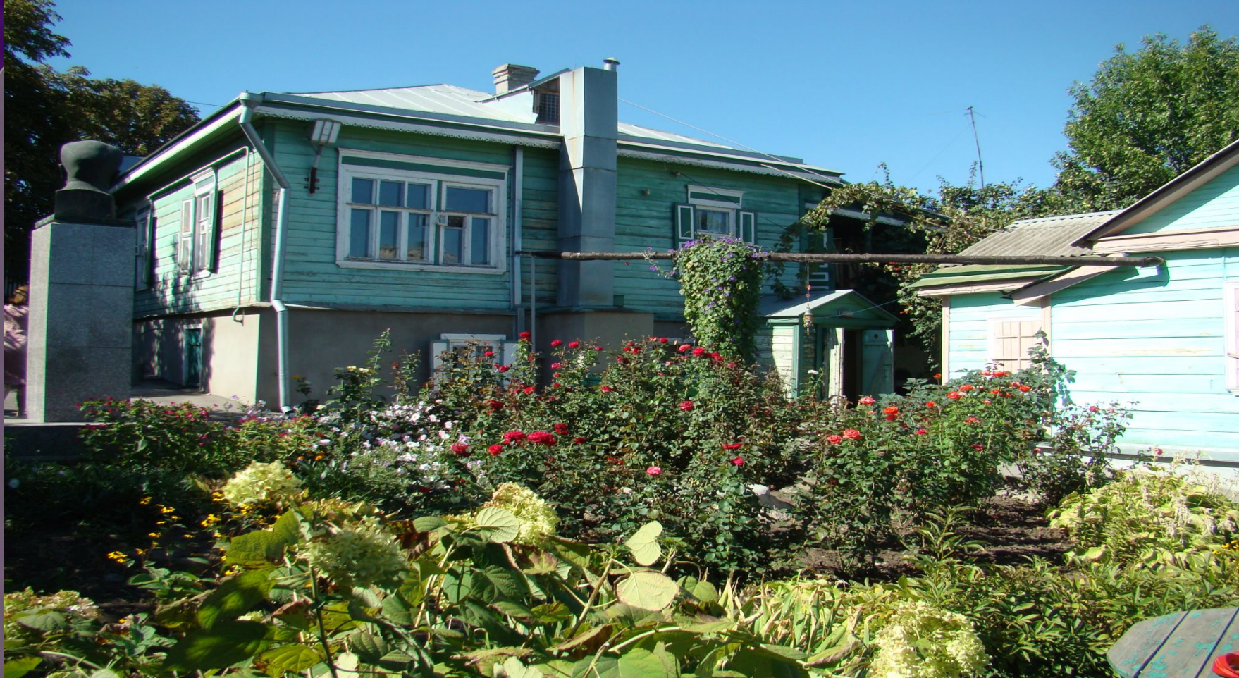
Обзорный снимок двора Дома-Музея в г. Новочеркасск