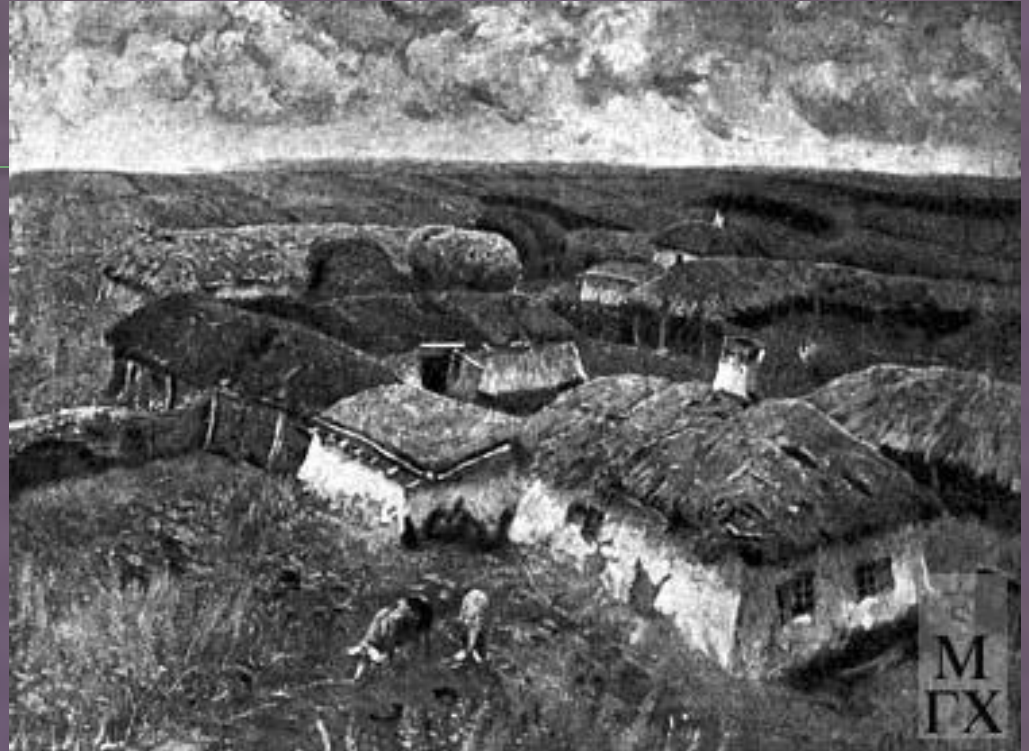
Хутор Шарпаевка. 1912 г.

Детство юного художника прошло в хуторе Шарпаевка Яновской волости Донецкого округа Области Войска Донского ( ныне Ростовская область)