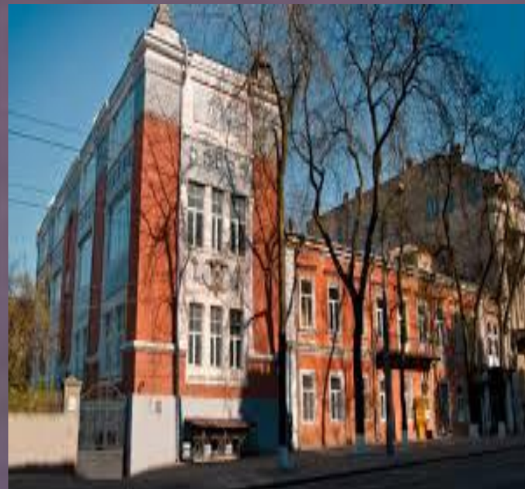
Одесское художественное училище имени М. Б. Грекова