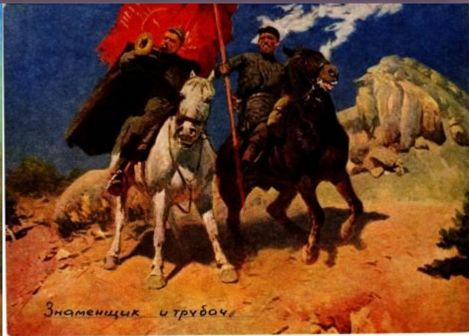
«Трубач и знаменщик»