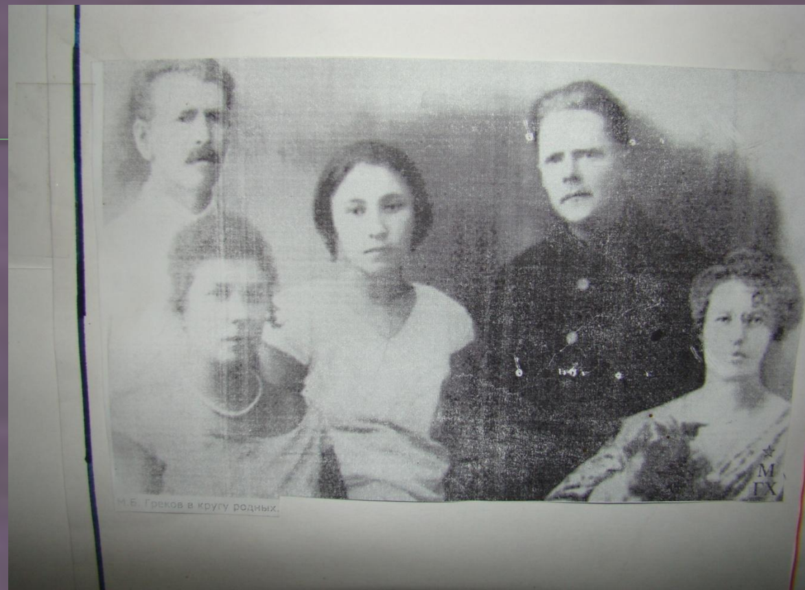
М. Б. Греков в кругу родных.

Он был большим любителем истории казачества, истории родного Дона, выписывал иллюстративные издания по военной истории России, в семье имелась неплохая библиотека. Эта любовь к прошлому своего Отечества передалась сыну