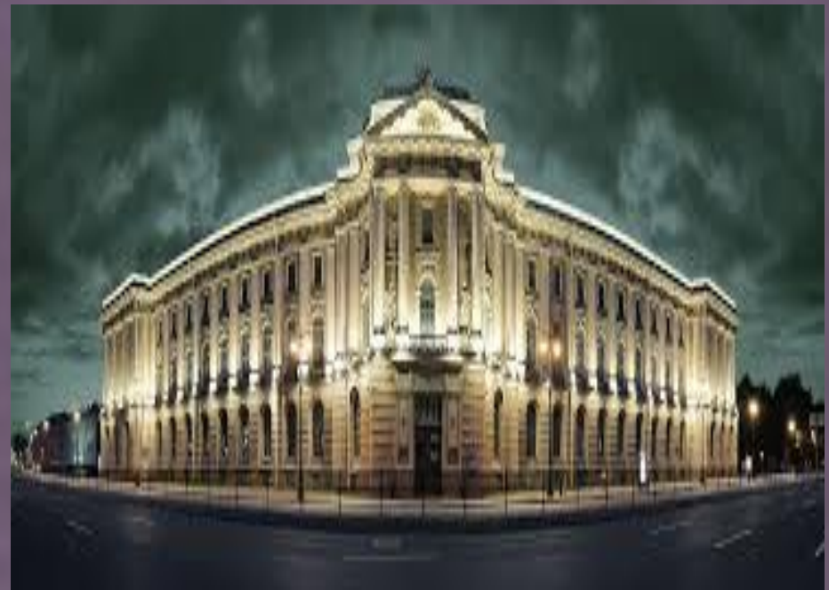
Санк-Петербургская академия художеств 2016 г.