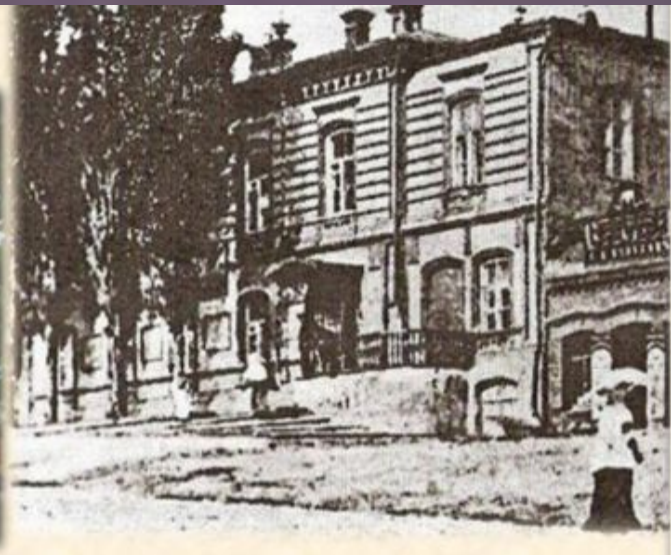
Окружное училище в ст.Каменской ( ныне г. Каменск)