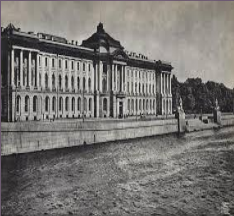
Санкт-Петербургская академия художеств в начале 20 века

В 1903 году Митрофан Борисович поступает в Санкт-Петербургскую академию художеств. Молодой художник продолжил своё образование у таких великих российских мастеров кисти, как И. Е. Репин и Ф. А. Рубо. То есть школа батальной и исторической живописи, которую он прошёл в городе на берегах Невы, была высокопрофессиональной.