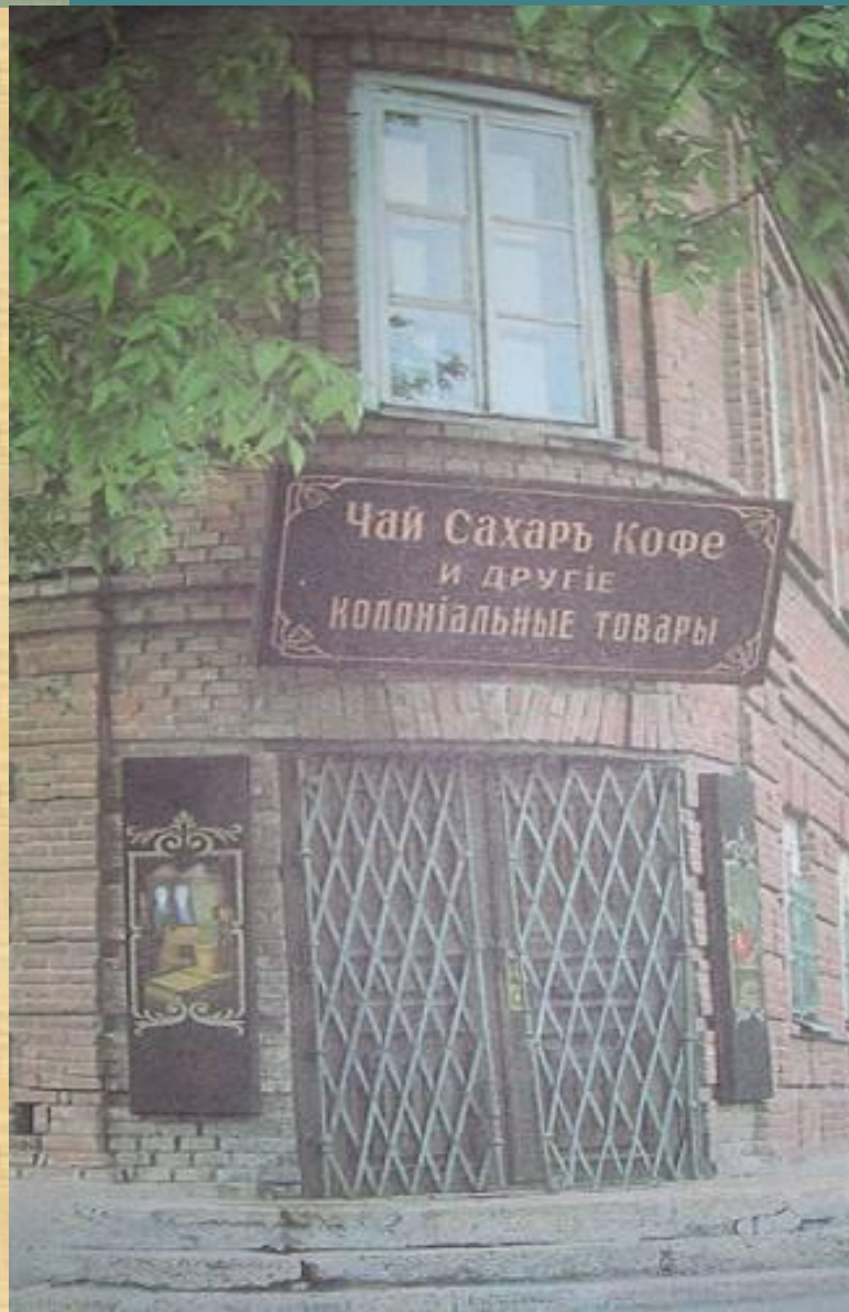
Бакалейная лавка Чеховых