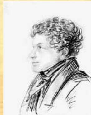
Брат, Лев Сергеевич Пушкин (1805-1852г.)