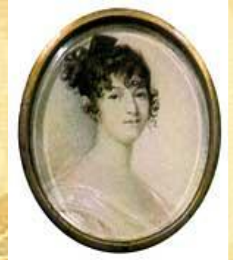
Мать, Надежда Осиповна Пушкина (1775-1836г.) , была внучкой Ибрагим Ганнибала – «арапа Петра Великого»