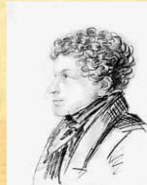
Брат, Лев Сергеевич Пушкин (1805-1852г.)