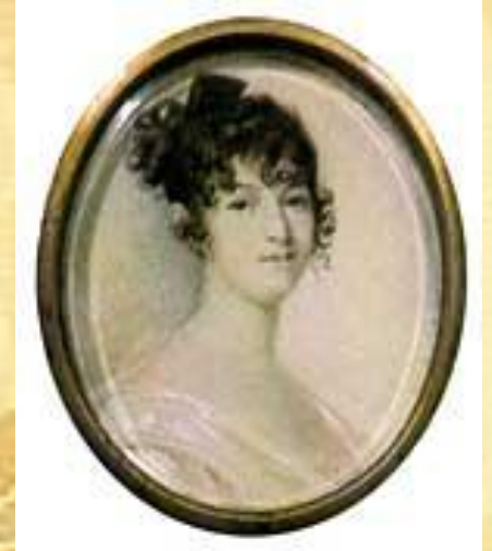
Мать, Надежда Осиповна Пушкина (1775-1836г.) , была внучкой Ибрагимма Ганнибала – «арапа Петра Великого»