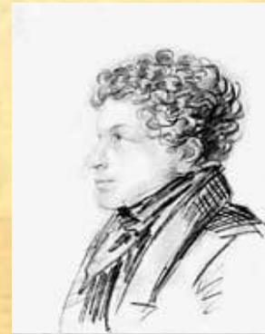
Брат, Лев Сергеевич Пушкин (1805-1852г.)