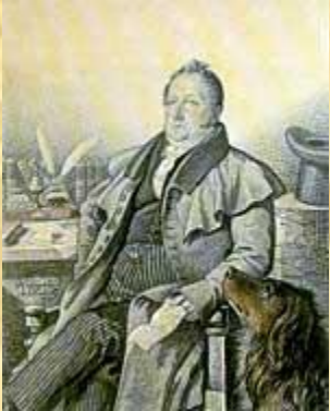
Отец , Сергей Львович (1770-1838г.), принадлежал к древнему дворянскому роду, упоминаемому в Летописях со времен Ивана Грозного