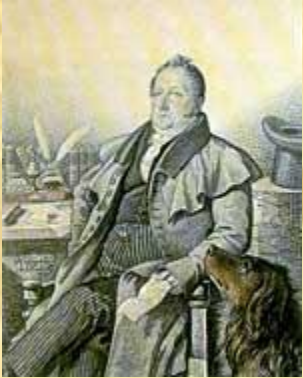
Отец , Сергей Львович (1770-1838г.), принадлежал к древнему дворянскому роду, упоминаемому в Летописях со времен Ивана Грозного