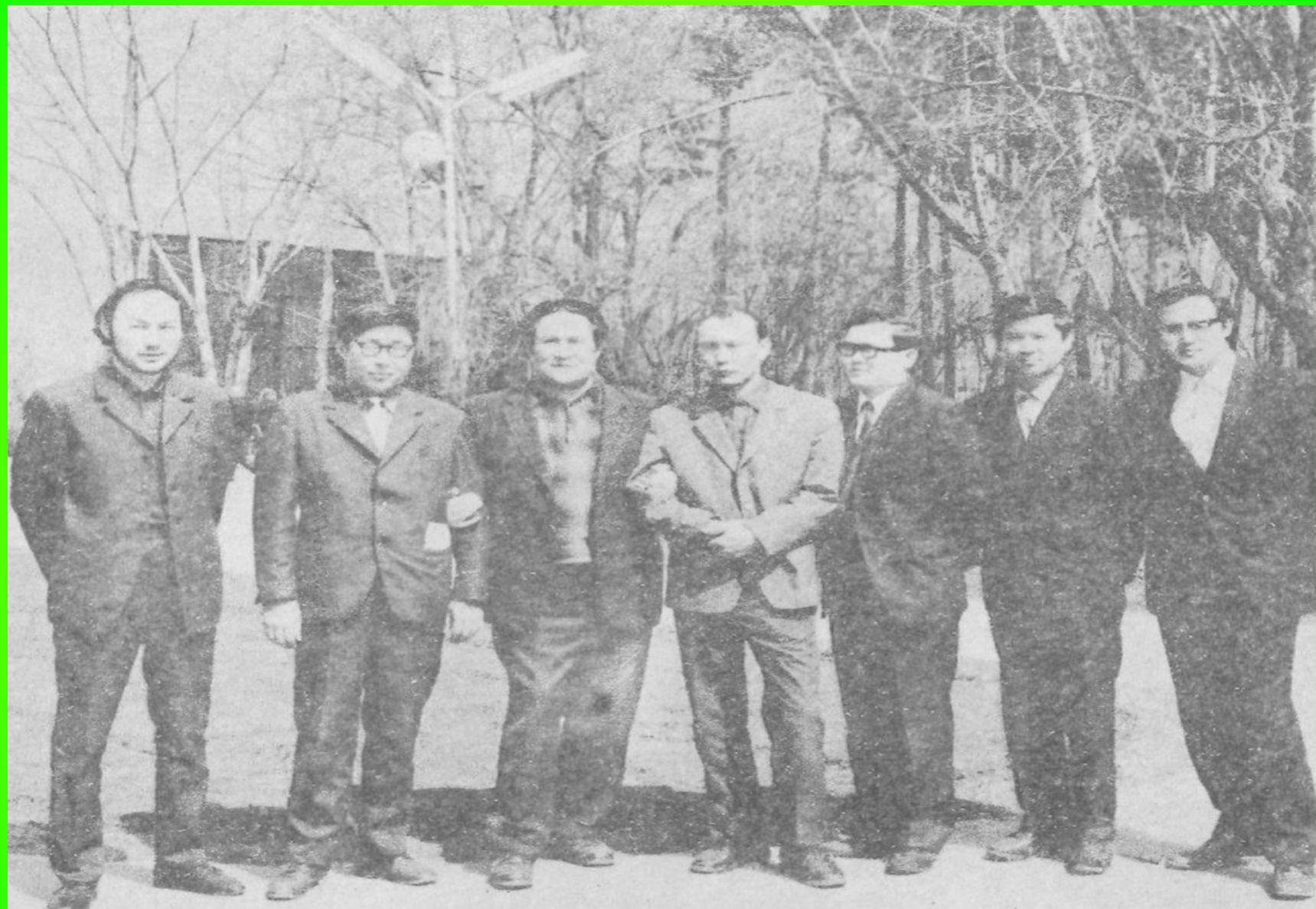
Мұқағали қаламдас жолдастарының арасында