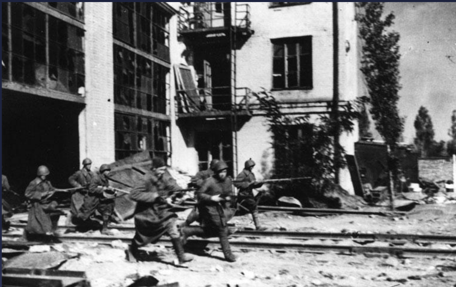
Бои за станцию Воропоново