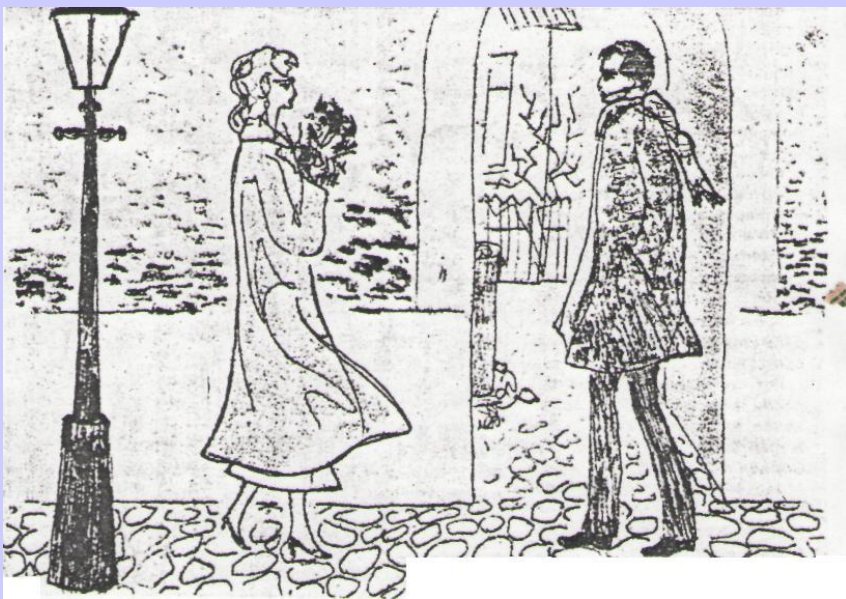
Иллюстрация Нади Рушевой к роману М. Булгакова «Мастер и Маргарита».

М. Булгаков. «Мастер и Маргарита». Ч.1 гл.13