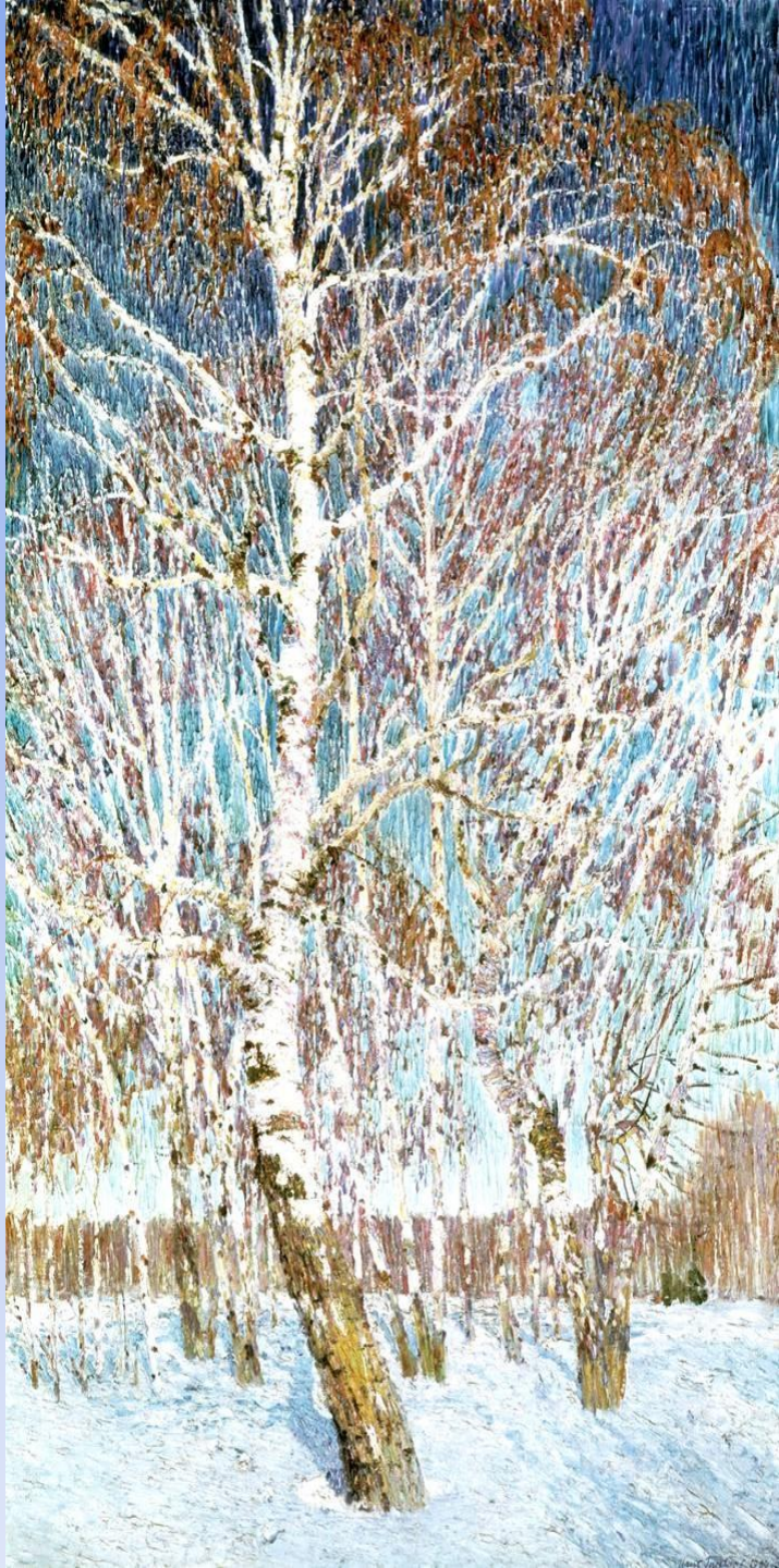
«Февральская лазурь» И.Э.Грабарь