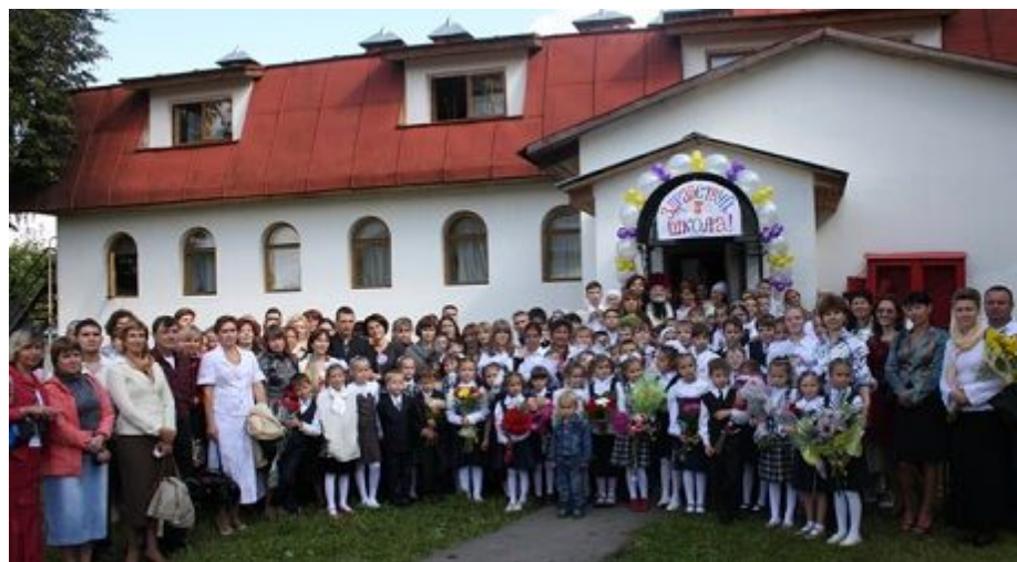
Православная гимназия при храме