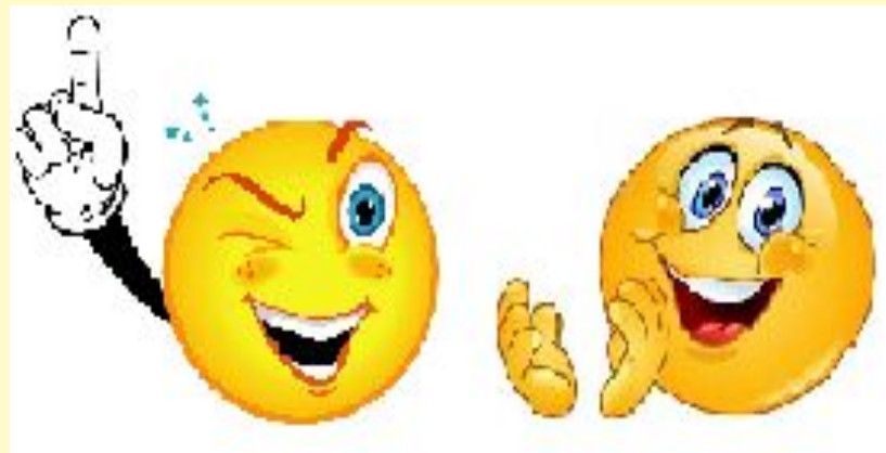
Смайлики (?) веселятся