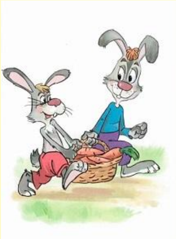
Зайцы (?) несут поливает