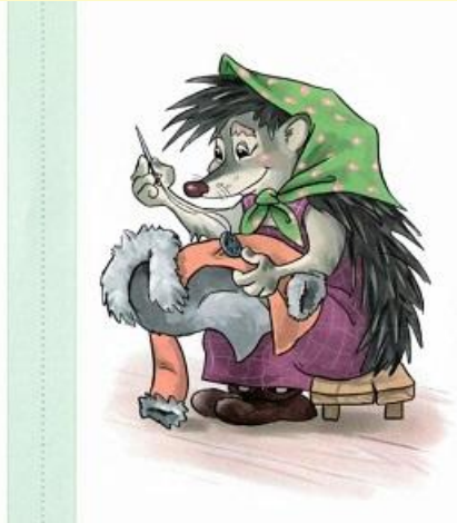
Ежиха (?) пришивает