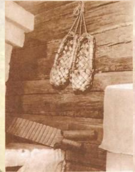
Интерьер дома- музея