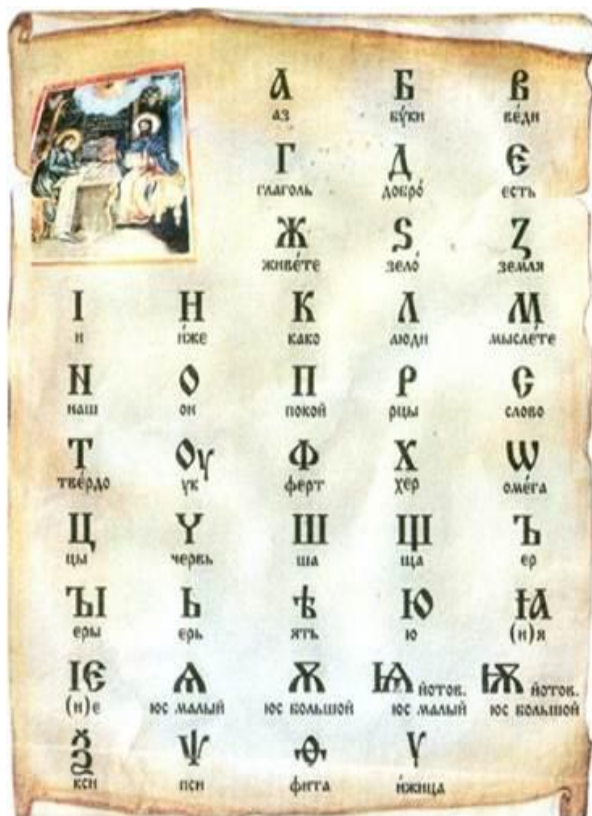
Кириллица (863 год)

Вторая реформа русского языка произошла в 1917-1918 годах.