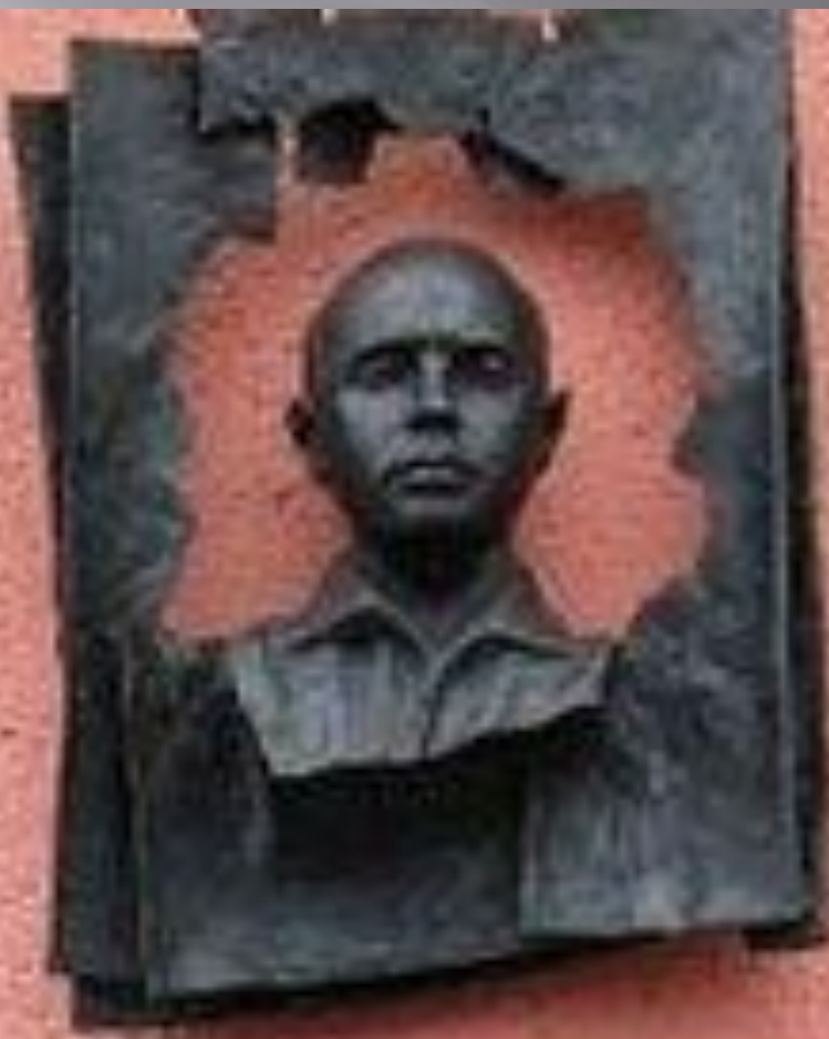
ПОЭТ АНДРЕЙ ПРАСОЛОВ