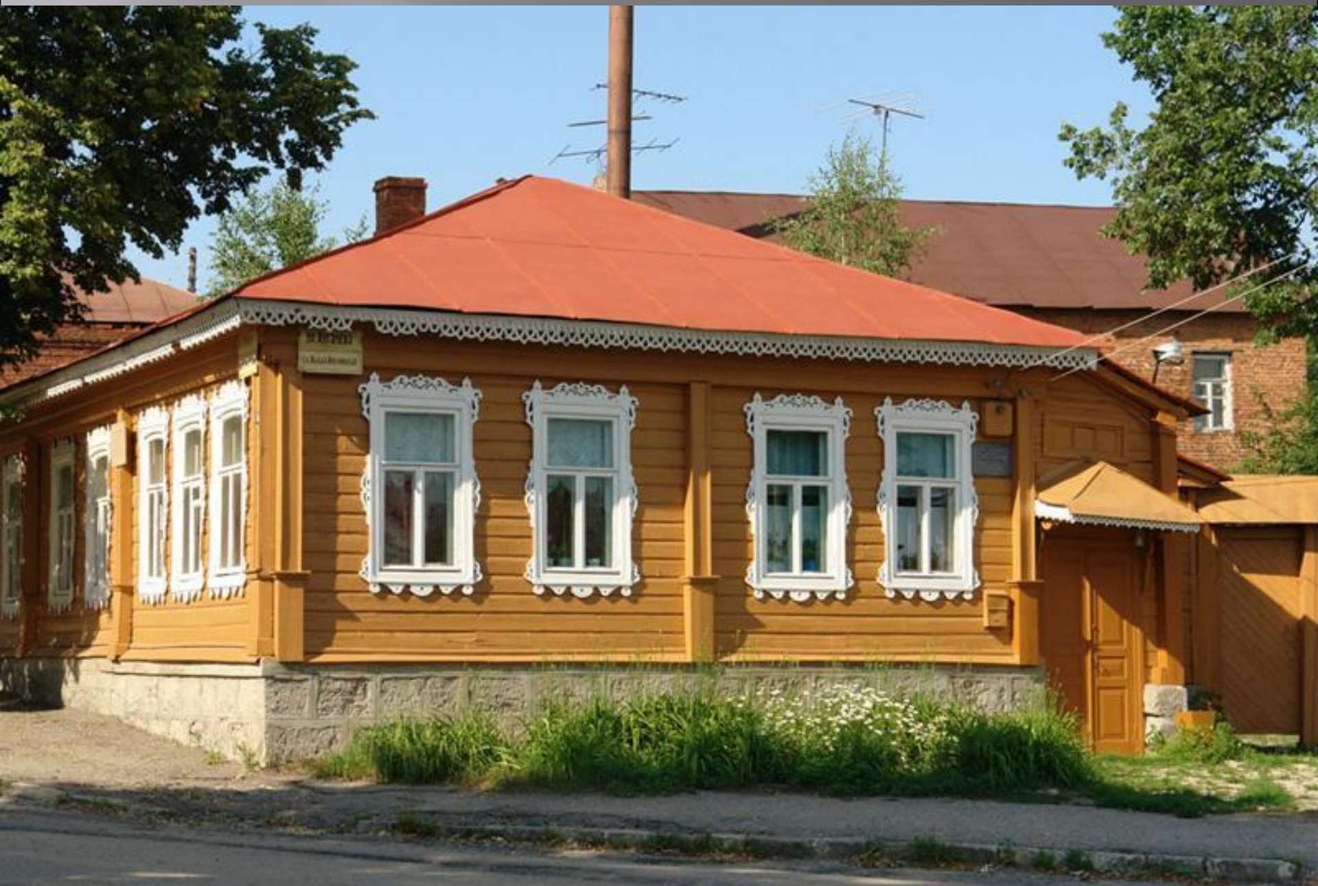
Дом-музей И. А. Бунина в г Елец