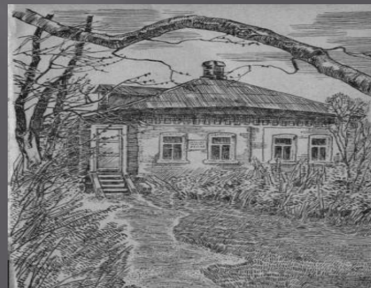
Домик Маршака в г.