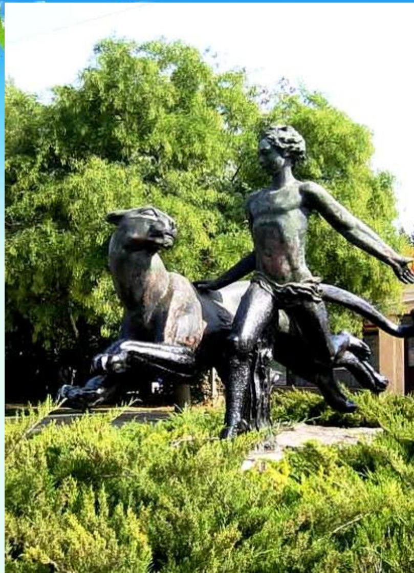
В городе Николаев, Украина.