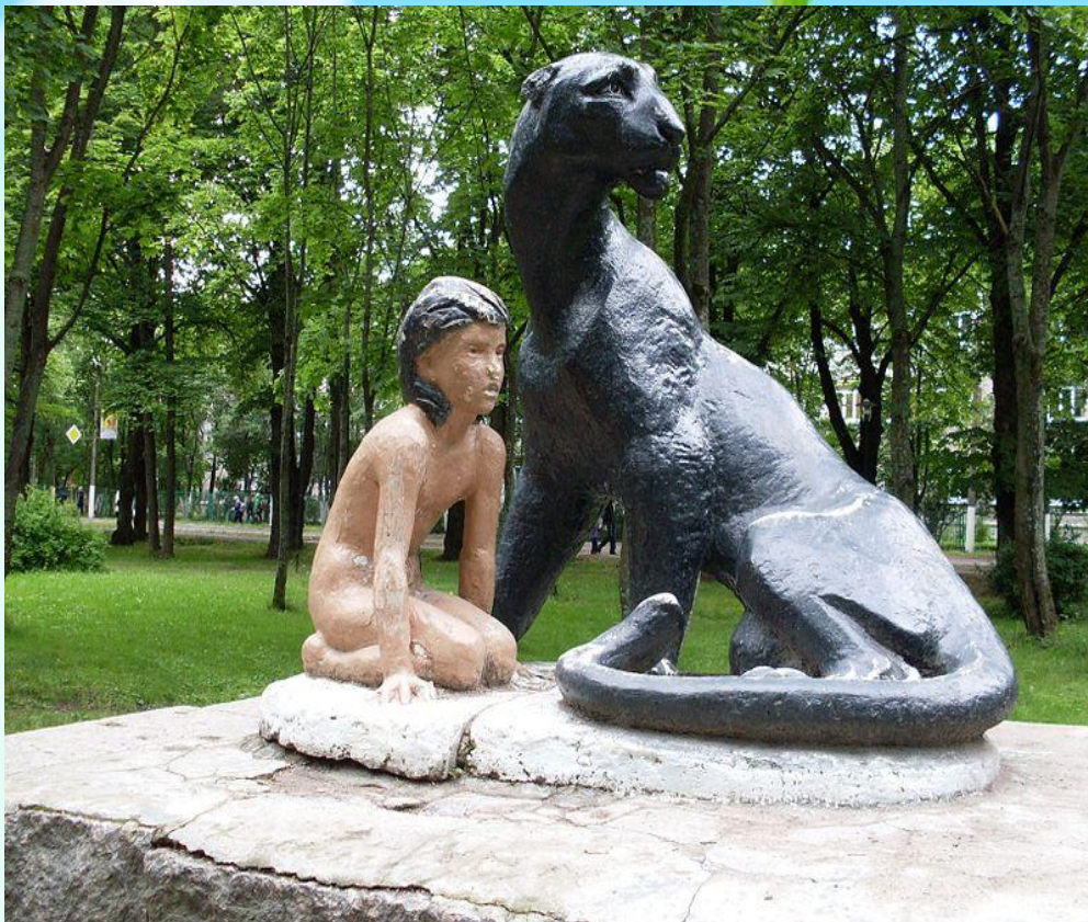
В городе Приозерске (под Питером)