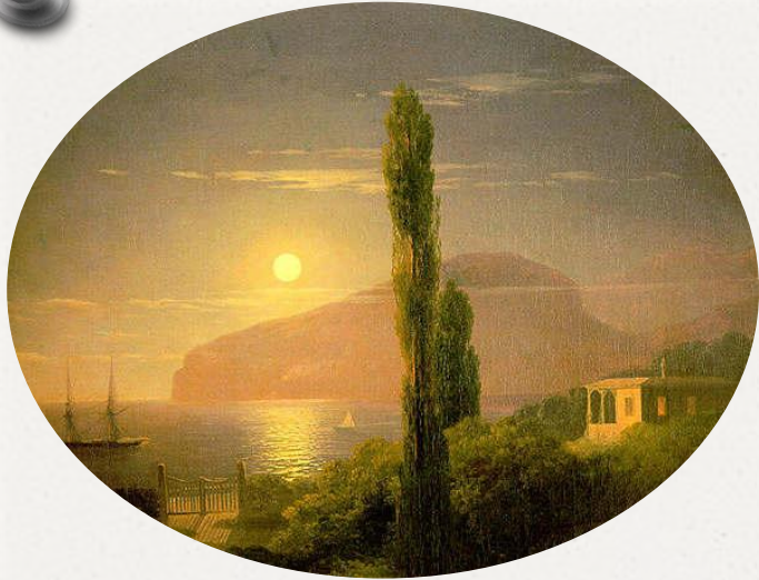
«Лунная ночь в Крыму»