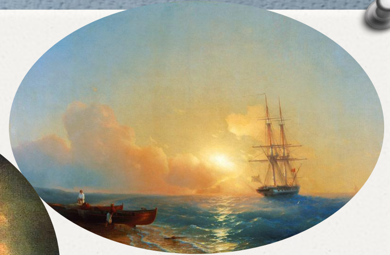
«Рыбаки на берегу моря»