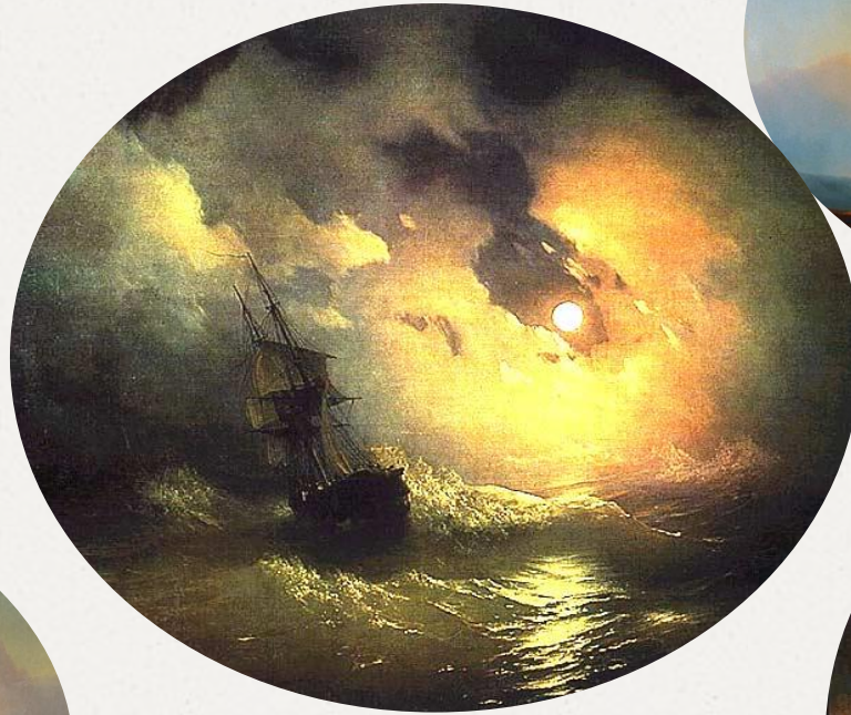
«Шторм в ночи»