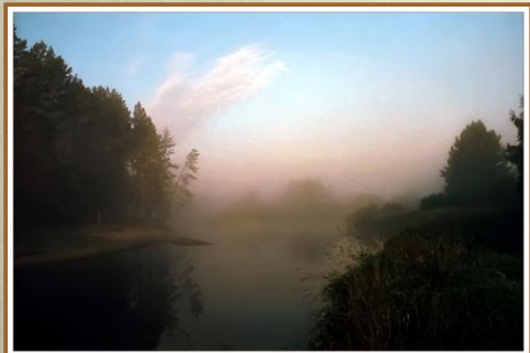
Левитан И.И. «Туманное утро»

«...Она была моею нравственной опорой, поддержкою моих сил, светлую стороною моей жизни, она заменяла мне живых людей...Она никогда мне не изменяла, всегда оставалась одинаковою ее божественная, вечная красота...»