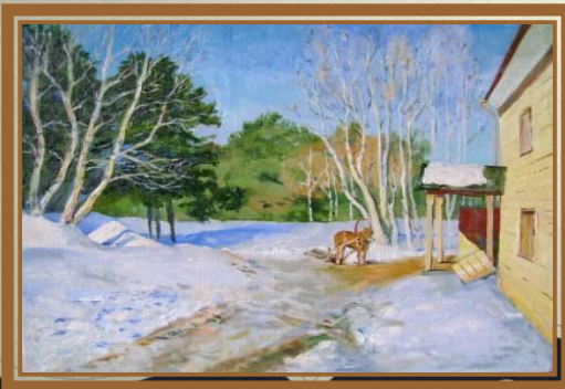
Левитан И.И. «Март»