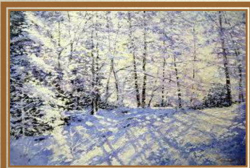
Шишкин И.И. «Зима»

Мир Пушкина огромен и прекрасен. Любое его стихотворение – это гимн красоте и любви. Поэт обожал русскую природу, его несказанное величие и посвятил ей немало прекрасных строк. Пушкин научил нас любить утреннюю свежесть весны, теплоту летних дней и великолепные зимние пейзажи. Из всех времен года поэт более всего любил осень.