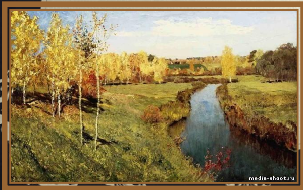
Левитан И.И. «Золотая осень»

«Лес, точно терем расписной, Лиловый, золотой, багряный, Веселой, пестрою толпой Стоит над светлою поляной.» (Отрывок «Листопад»)