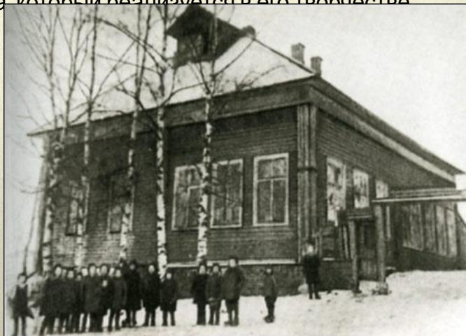
Никольское для Н.М.Рубцова – родная деревня

Каждая строка стихотворений поэта дышит любовью к родине. Исходное условие бытия человека для Н.Рубцова – в единстве с природой, неразделимости с ней. Кровная привязанность к родным местам порождает мысль о том, что главное, основное, стержень жизни – дом и родная деревня. Единство человека и природы, прошлого и настоящего – основа мировосприятия Н.Рубцова. Простая русская деревня с ее привычным видом, простые, деревенские люди, размеренная жизнь человека в труде и повседневных человеческих заботах – вот тот нравственный идеал поэта, который реализуется в его творчестве.