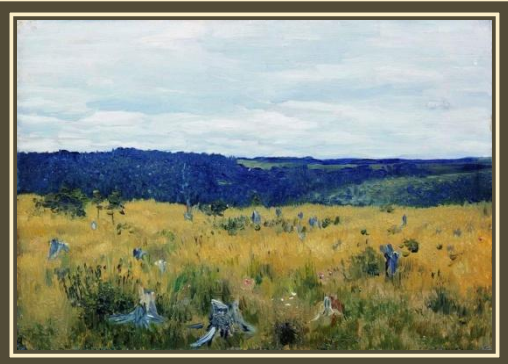
И. Левитан «Степь.» Этюд

Поэт живет мечтой о сохранении единства природы и человека, это основа его мировосприятия. Автор обращается к нравственным и трудовым традициям народа, создает свои представления о жизни.