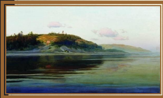
Левитан И.И. «Летний вечер»