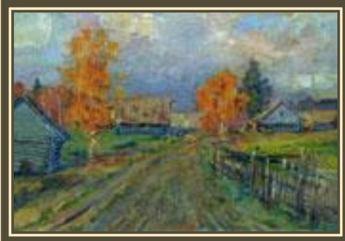
«Осенний пейзаж» И.Левитан