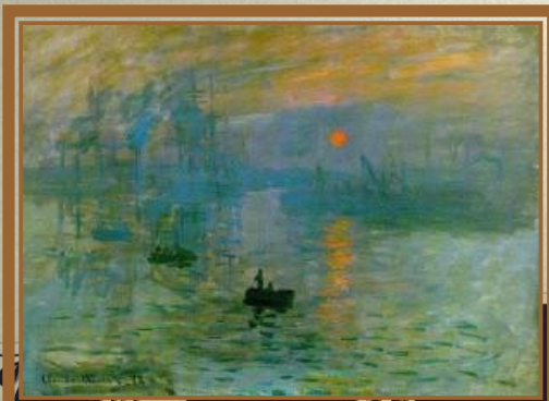
Клод Моне «Впечатление, восход солнца»

Звёзды меркнут и гаснут. В огне облака. Белый пар по лугам расстилается. По зеркальной воде, по кудрям лозняка От зари алый свет разливается. Дремлет чуткий камыш. Тишь - безлюдье вокруг. (Отрывок «Утро»)