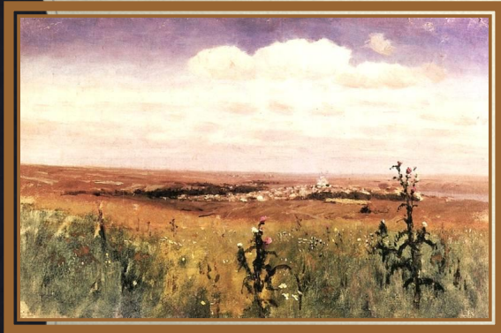
Куинджи А.И. «Степь»

Многие стихотворения поэта посвящены природе, носят повествовательный характер, рассказывают о волнениях сердца и человеческой судьбе. Простодушие, непосредственность, сердечное волнение в стихотворении «Косарь» передают характерные для фольклора обращения к действующим лицам, как к людям, так и к селу, степи, ветру, травам и цветам.