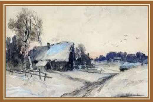
Саврасов А.К. «Деревня зимой»

«Вот моя деревня; Вот мой дом родной; Вот качусь я в санках По горе крутой;...»