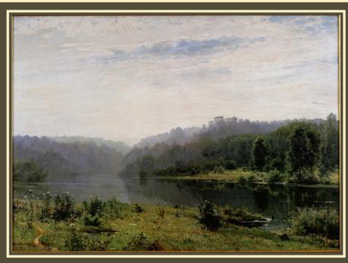
Шишкин И.И. «Туманное утро.»