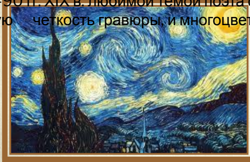
Ван Гог гравюра «Звездная ночь»

В 80-90 гг. XIX в. любимой темой поэта стала природа. Его стиль совмещает в себе и острую четкость гравюры, и многоцветную живопись.