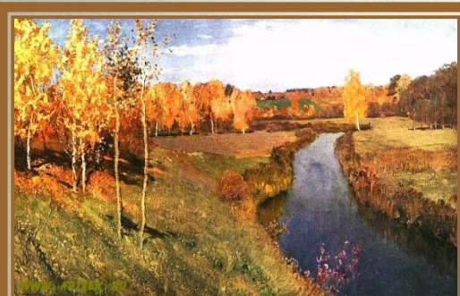
Левитан И.И. «Золотая осень»

Ох, лето красное! любил бы я тебя, Когда б не зной, да пыль, да комары, да мухи. Ты, все душевные способности губя, Нас мучишь; как поля, мы страждем от засухи; Лишь как бы напоить да освежить себя - Иной в нас мысли нет, и жаль зимы-старухи, И, проведив ее блинами и вином, Поминки ей творим мороженым и льдом.