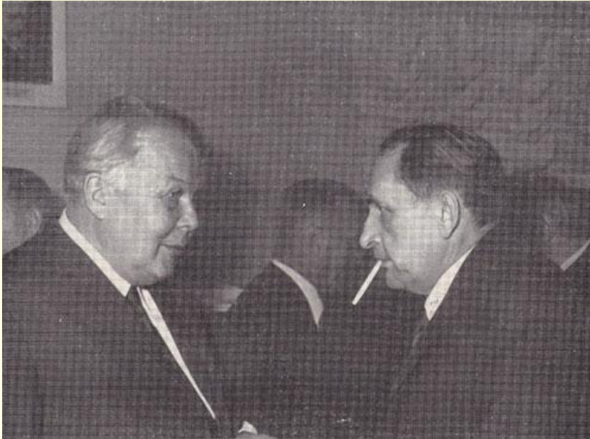
Я.В.Смеляков (справа) и А.Т.Твардовский.