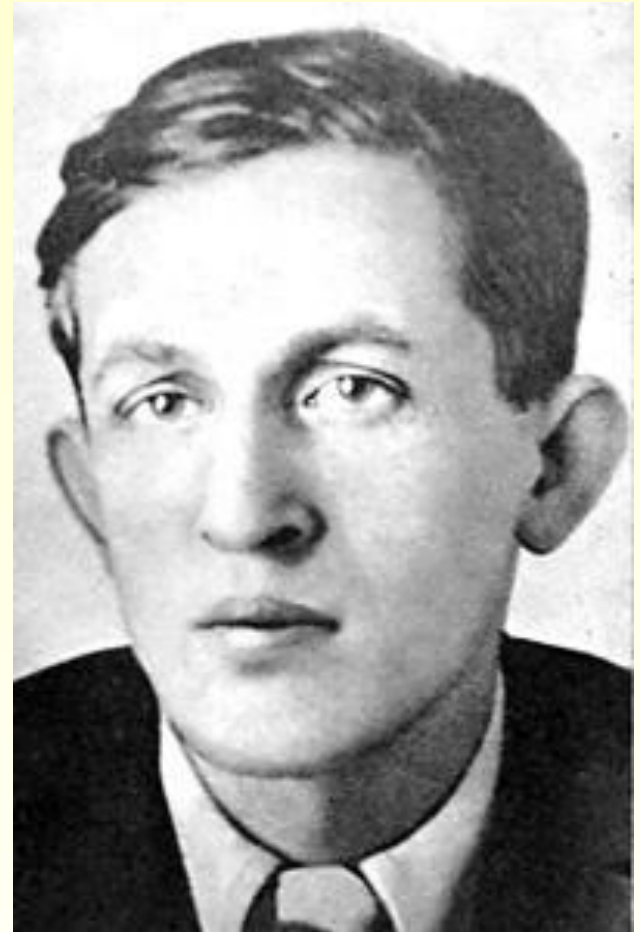
Я.В.Смеляков (1930-е годы)

Ярослав Смеляков родился в городе Луцке (Украина) в семье железнодорожного рабочего. Раннее детство его прошло в деревне. В деревенской школе получил начальное образование, а после переезда в Москву продолжил обучение в московской семилетке. Рано начал писать стихи. В 1931 окончил полиграфическую фабрично-заводскую школу, где публиковал свои стихи в цеховой стенгазете, писал обзоры для агитбригады. В это же время занимался в литературных кружках при «Комсомольской правде» и «Огоньке».