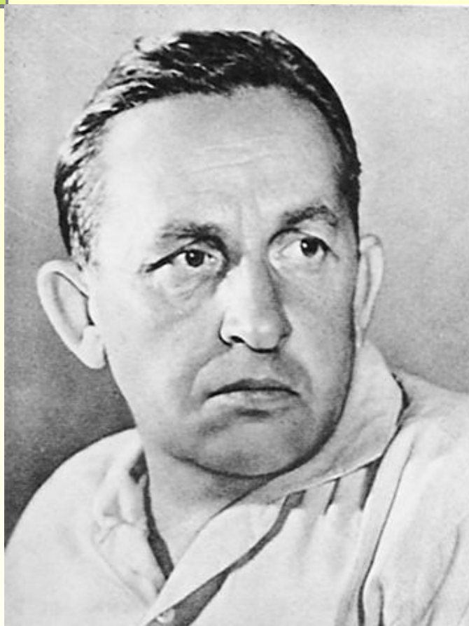
Я.Смеляков, 1950-е годы.

В 1951 по доносу двух поэтов вновь арестован и отправлен в заполярную Инту. Домой Я.В. Смеляков возвратился лишь в 1955 году, освободившись по амнистии.