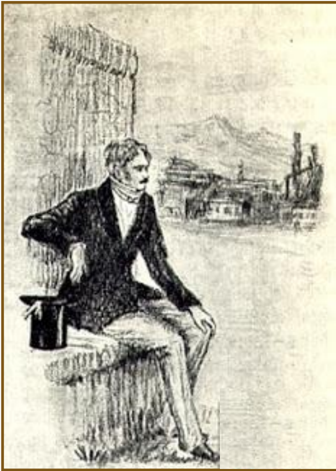
Худ. П. Павлинов

❖ История души человеческой, хотя бы самой мелкой души, едва ли не любопытнее и не полезнее истории целого народа, особенно когда она - следствие наблюдений ума зрелого над самим собою и когда она писана без тщеславного желания возбудить участие или удивление.