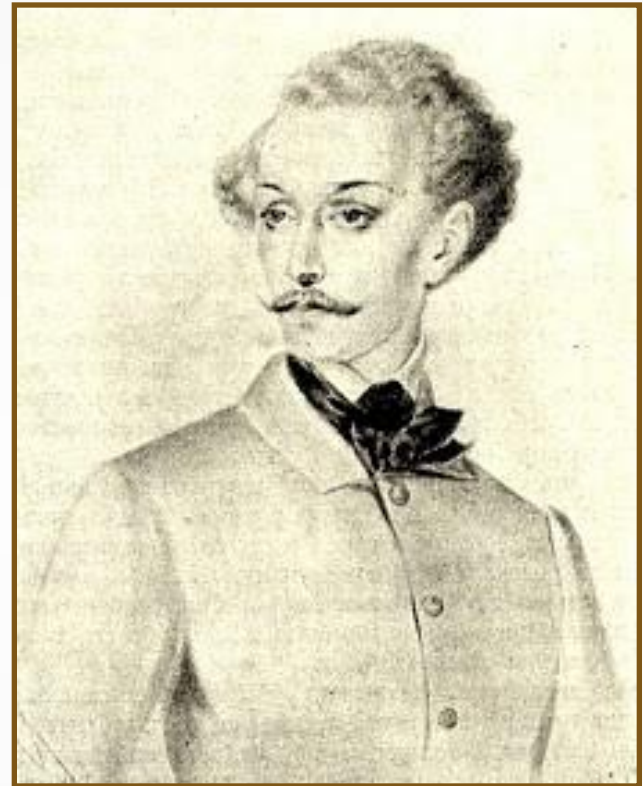
Худ. П. Боклевский