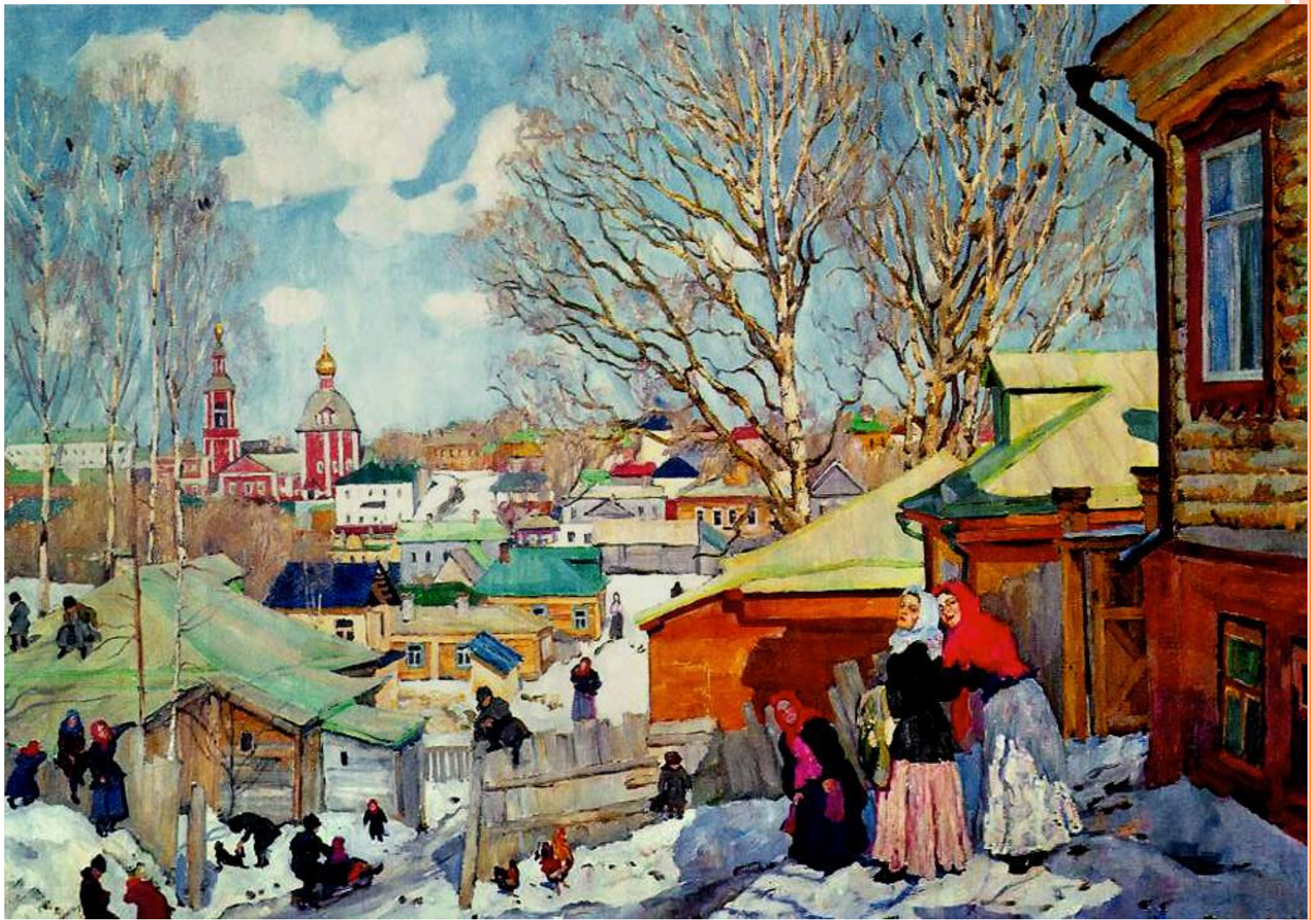
К.Ф. Юон «Весенний солнечный день» (1910)