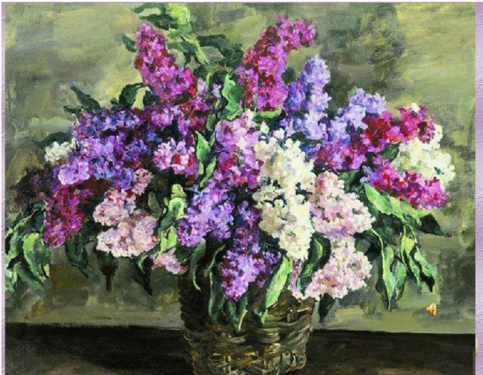
П.П. Кончаловский «Сирень в корзине» (1933)