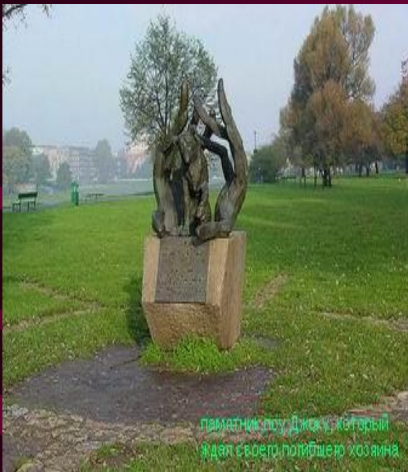
памятник псу Джоку, который ждал своего погибшего хозяина

Этому псу поставлен памятник в городе Кракове. Пес целый год ждал на Грюнвальдском кольце своего погибшего хозяина, который скончался от сердечного приступа. После он все же выбрал себе хозяйку – пожилую женщину. Когда она умерла, Джоска поместили в собачий приют, откуда он сбежал и бросился под поезд.