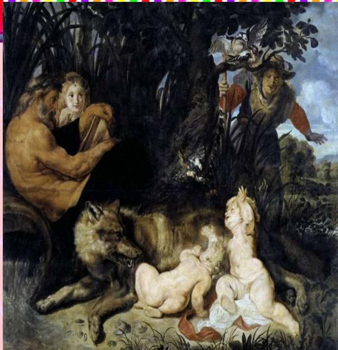
Рубенс «Ромул и Рем». Пещера волчицы

Разгневанный Амулий заклучил её под стражу, а младенцев приказал положить в корзину и бросить в реку Тибр. Однако корзину прибило к берегу у подошвы Палатинского холма, где их вскормила волчица,