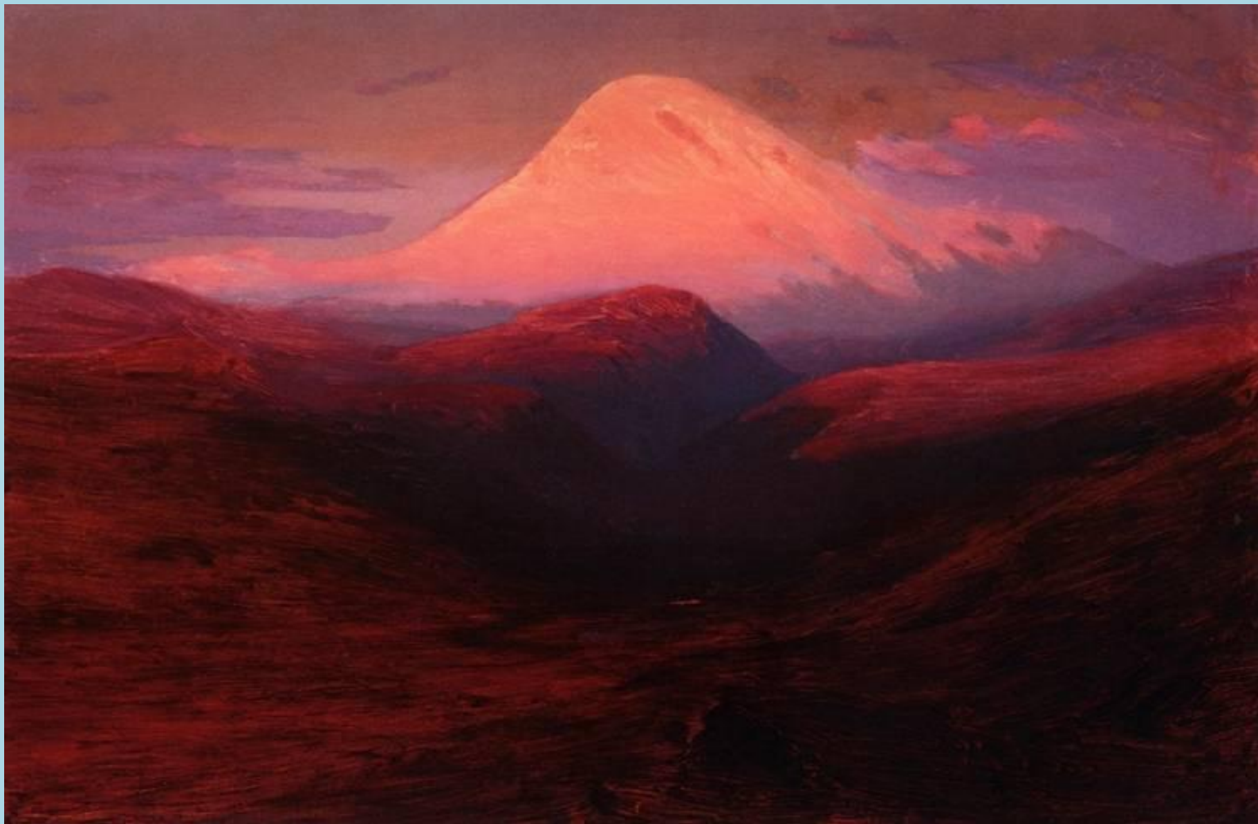
Картина А.И. Куинджи Малиновый "Эльбрус вечером» 1898—1908 гг.