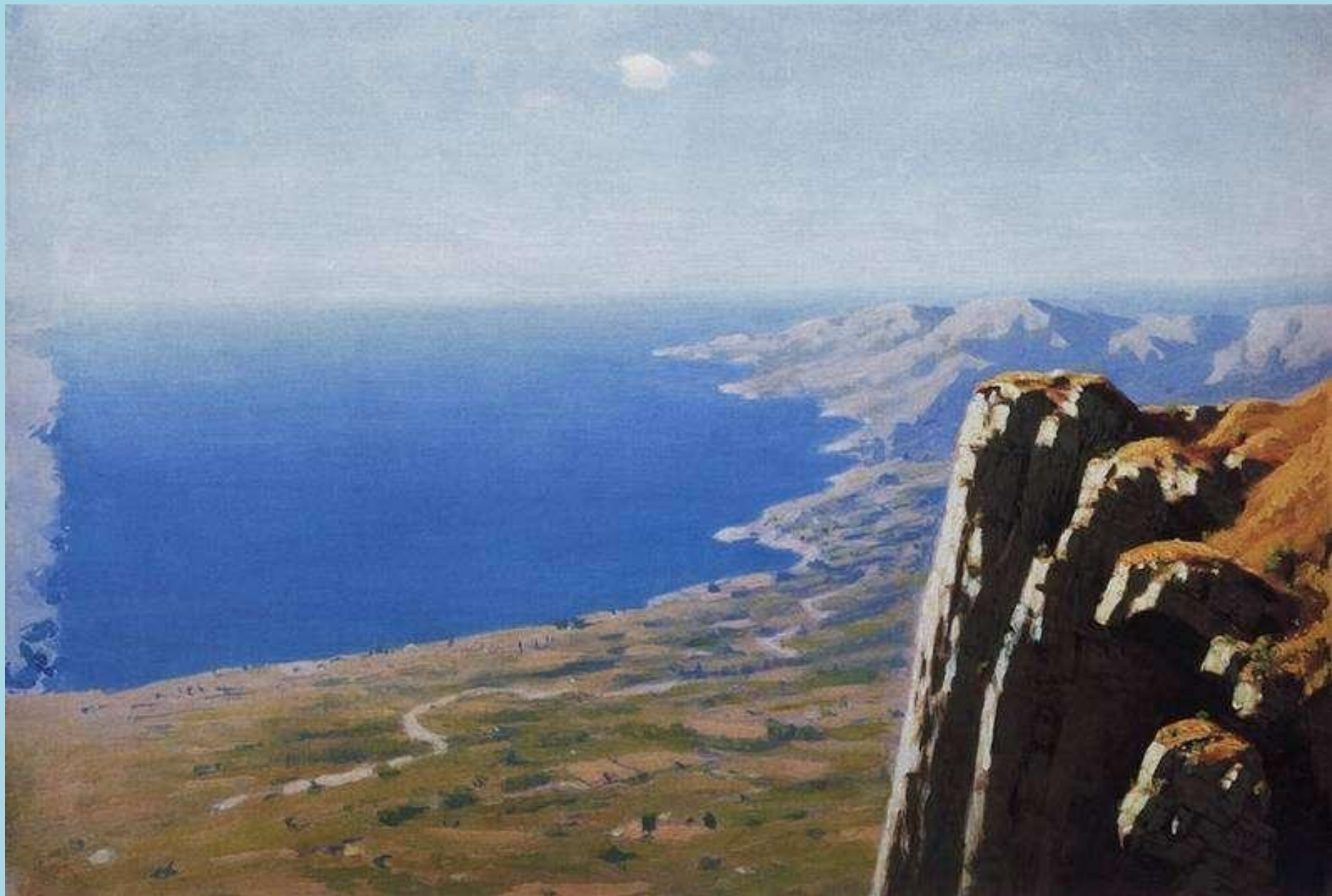
Картина А.И. Куинджи «Берег моря со скалой»