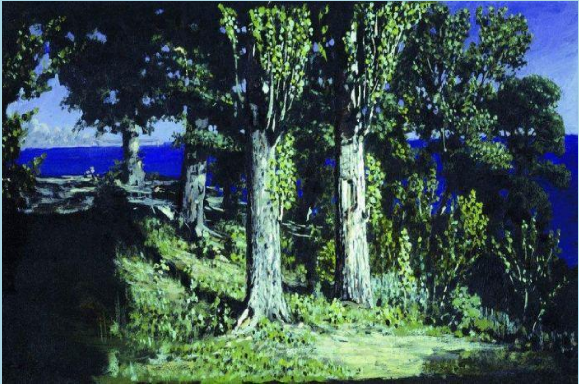
Картина А.И. Куинджи «Кипарисы на берегу моря. Крым»