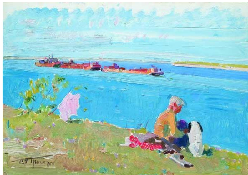
«Морской волк» 1950