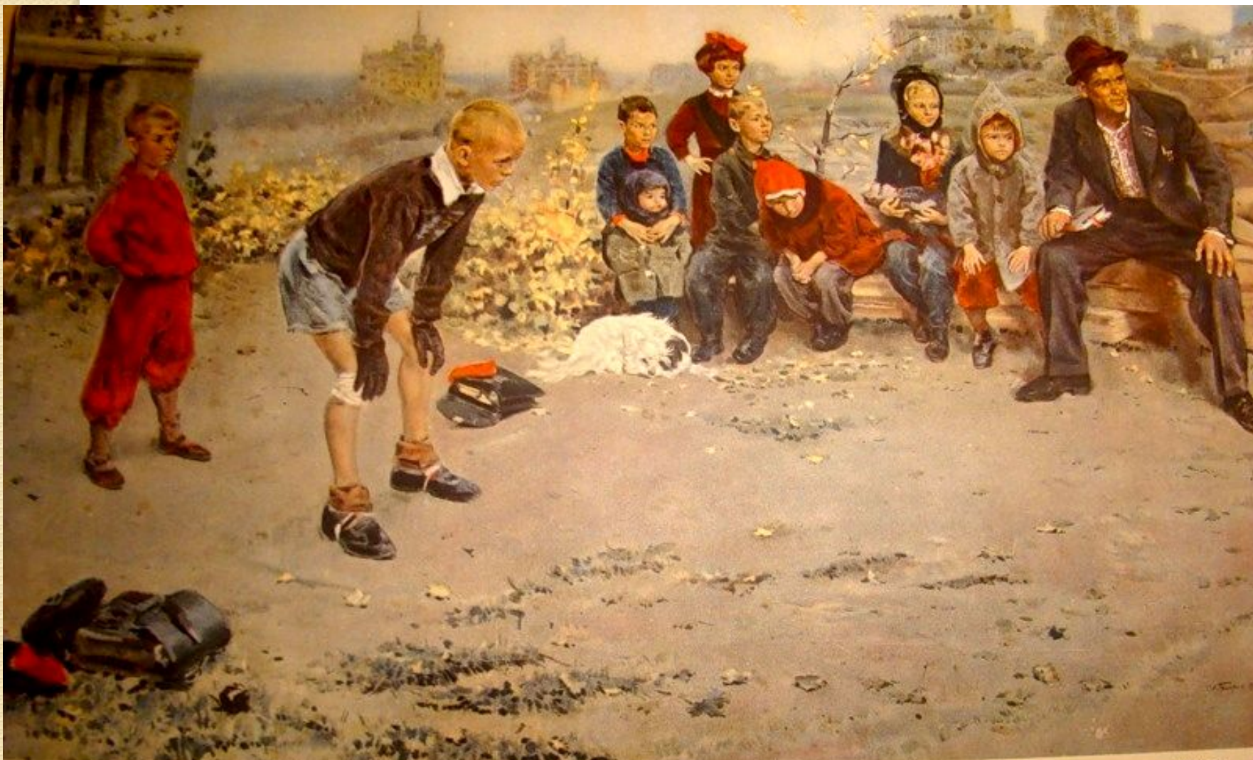
С. Григорьев «Вратарь». 1949.