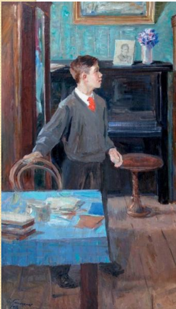
«Пионер» 1951 год