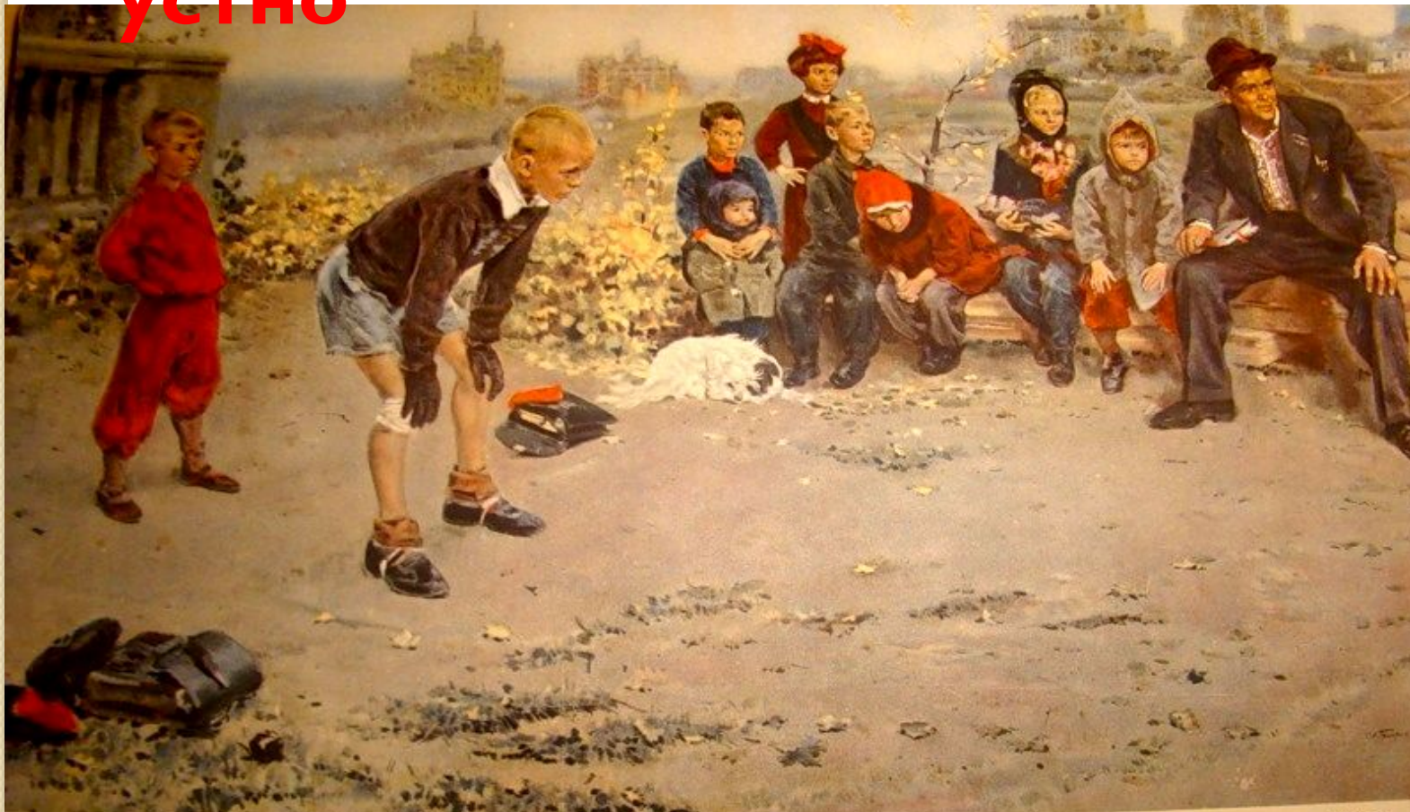
С. Григорьев «Вратарь». 1949.