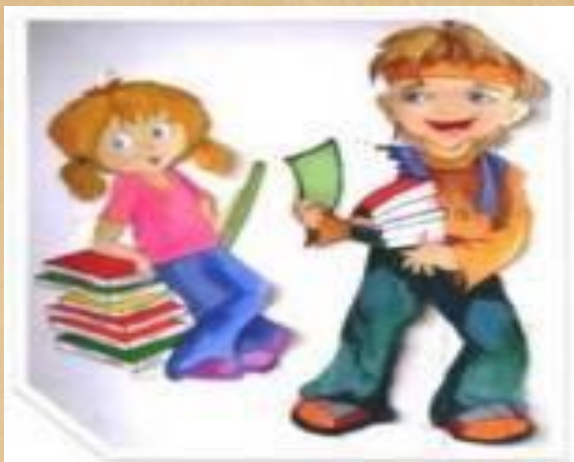
Ученики 2 класса Продавцы книг