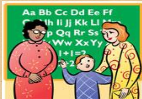
Учитель и родители.