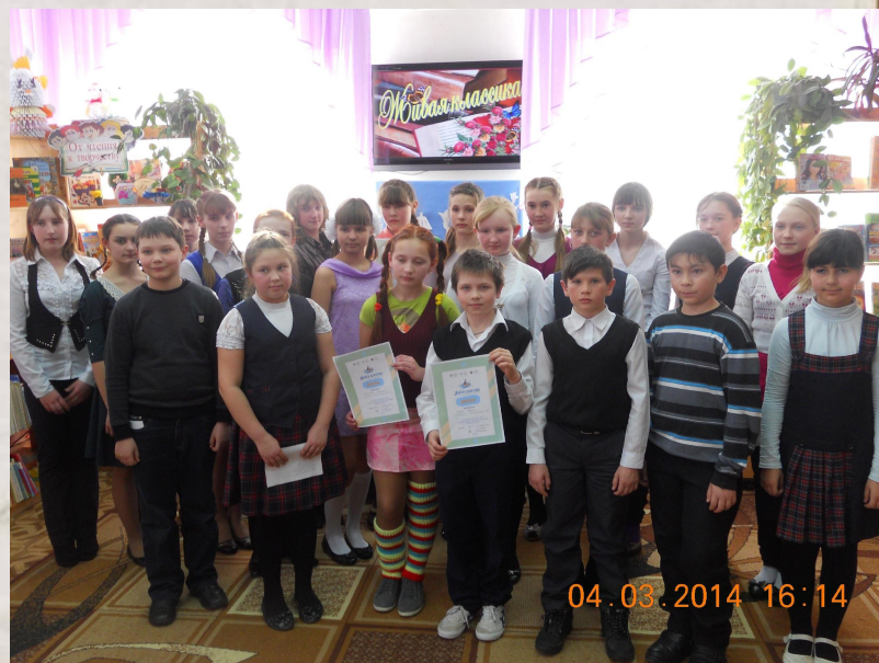
районный этап конкурса «живая классика» 2013 – 2014 уч. год