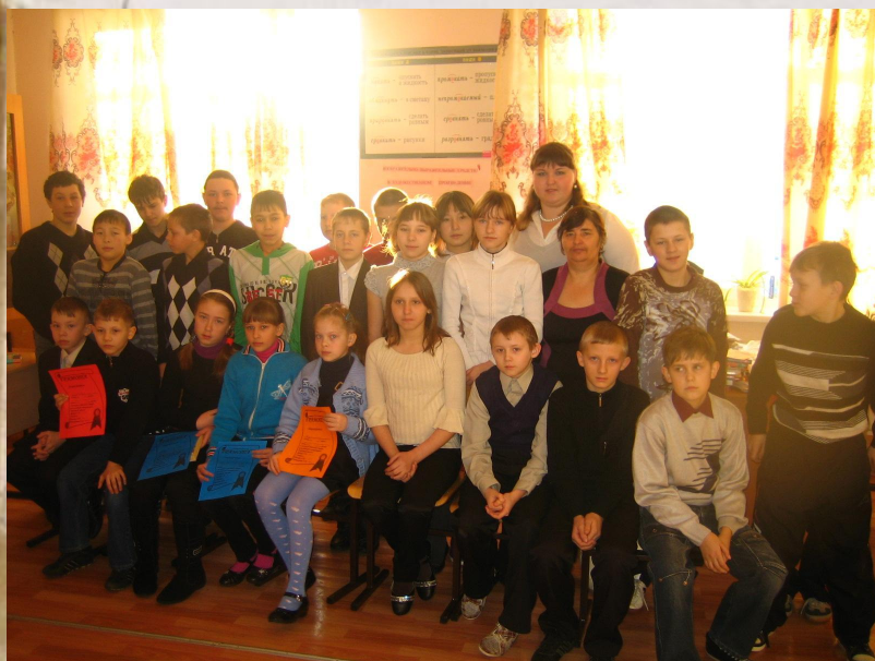
школьный этап конкурса «живая классика» 2012 – 2013 уч. год