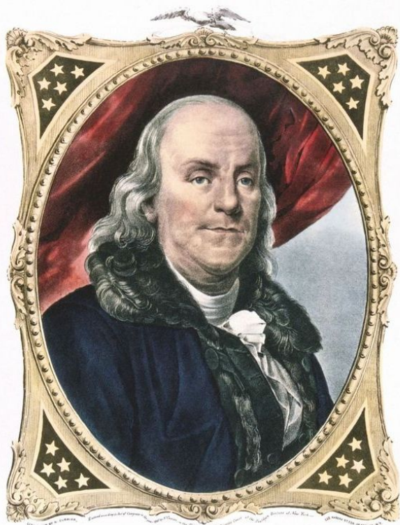
BENJAMIN FRANKLIN. THE STATESMAN AND PHILOSOPHER.

«Скажи мне и я забуду. Научи меня и я запомню. Вовлеки меня и я выучу». Бенджамин Франклин