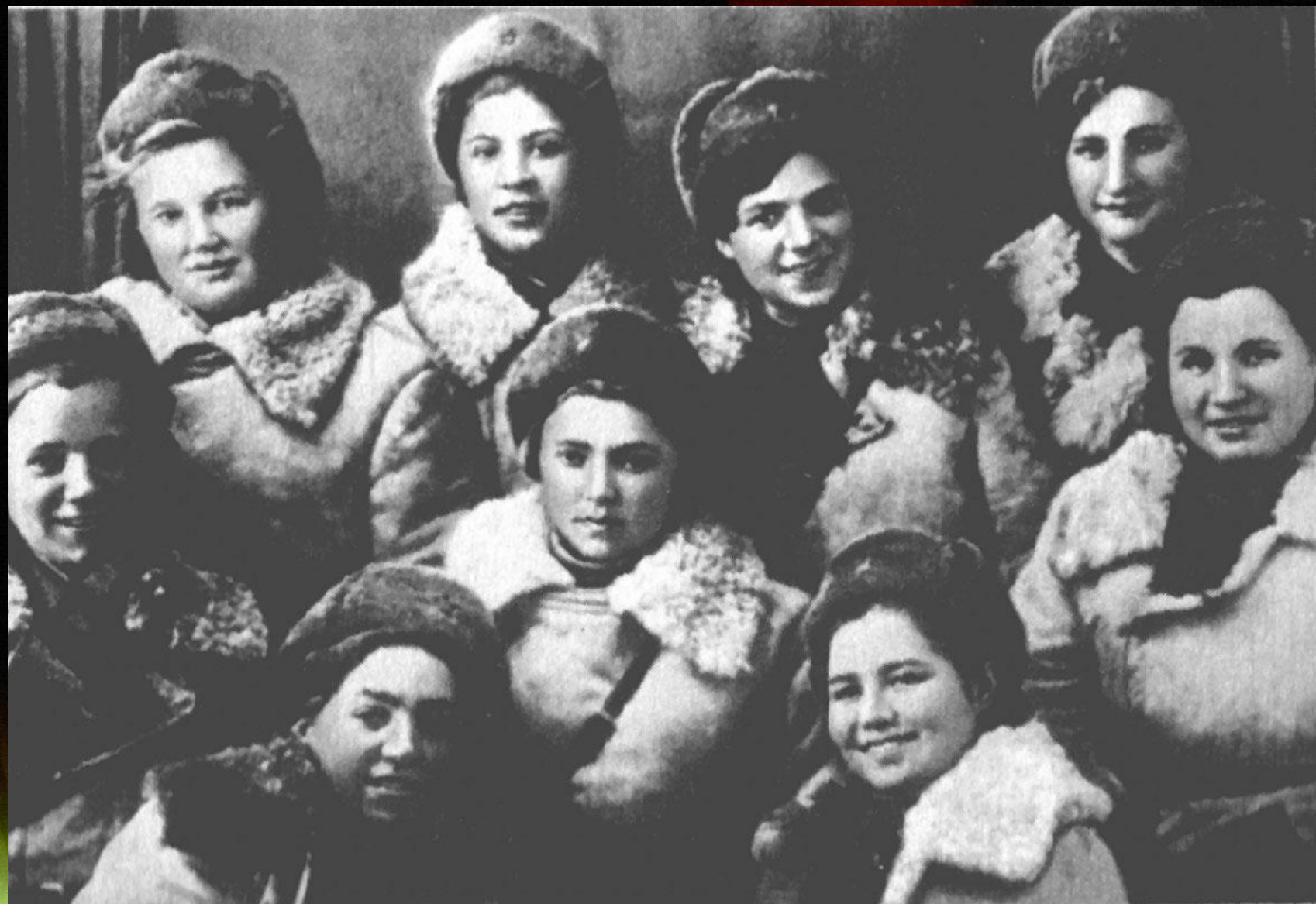
Девушки – партизанки