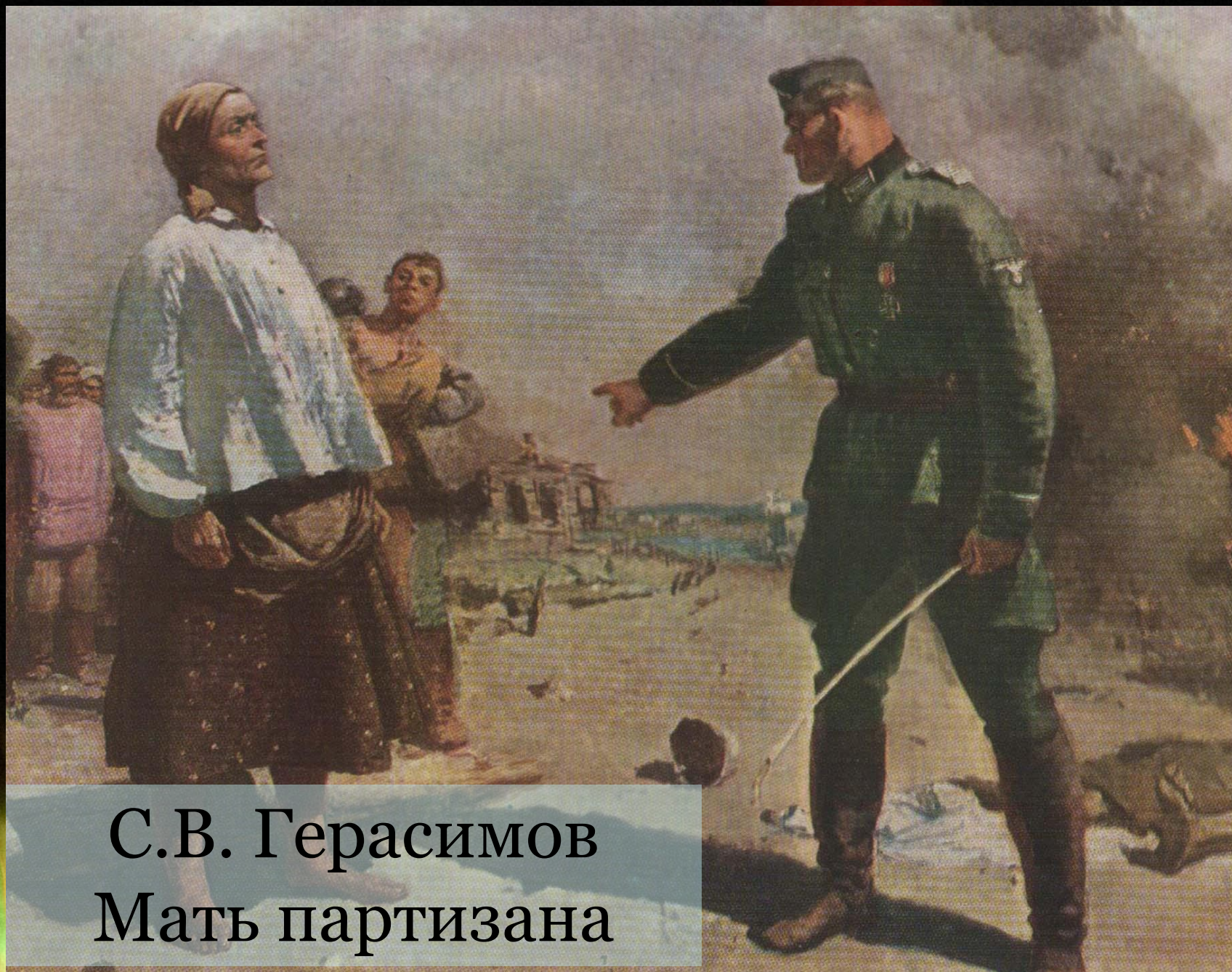
С.В. Герасимов Мать партизана