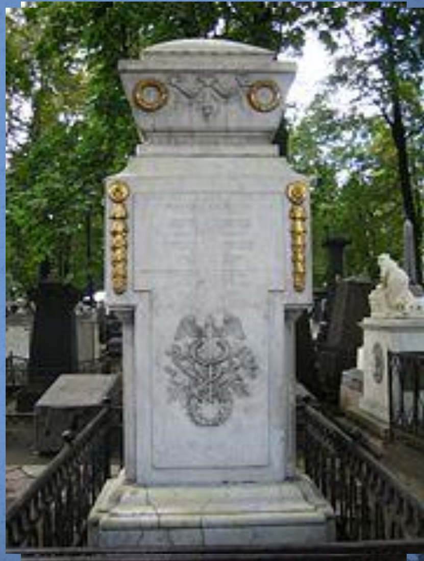
Могила М.В. Ломоносова

Ушёл из жизни М. В. Ломоносов в 1765г., он простудился и умер. Погребён на кладбище Александро- Невской лавры.