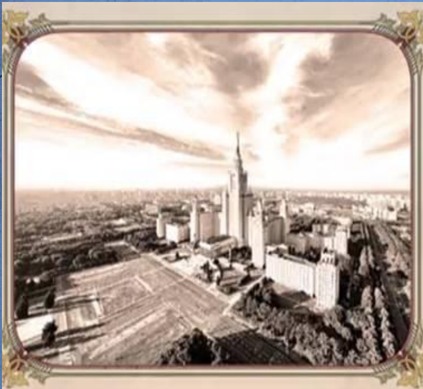
Вид на главное здание МГУ имени М.В. Ломоносова

В 1754 году разработал проект создания Московского университета. И через год, в 1755 году, в Москве открылся этот университет, который сейчас носит имя его создателя