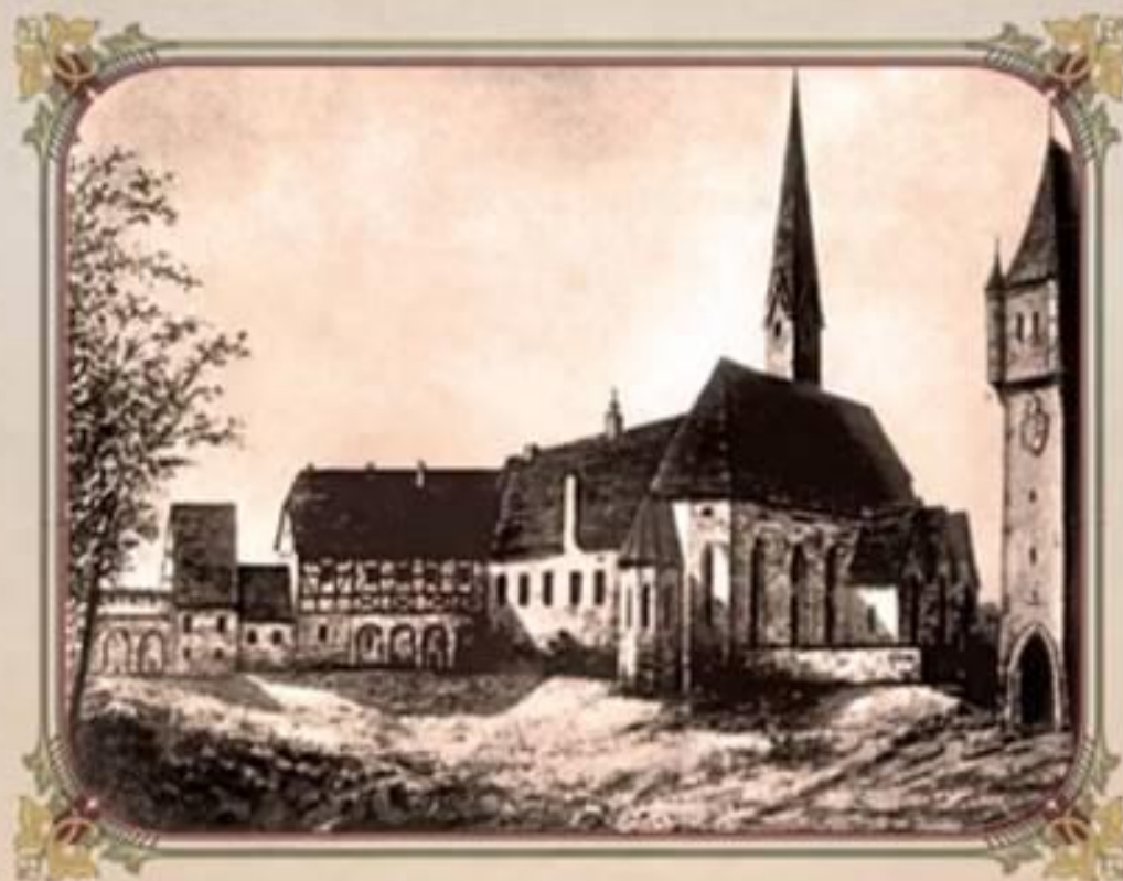
Вид Марбургского университета, в котором учился М.В. Ломоносов. Отрисовка гравюры конца XVIII века

Продолжил обучение в университетах Европы и уже в 34 года стал профессором химии.