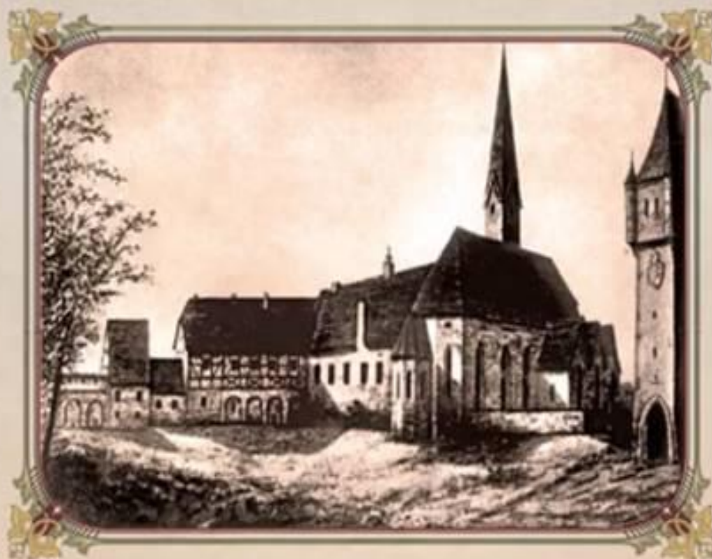
Вид Марбургского университета, в котором учился М.В. Ломоносов. Отрисовка гравюры конца XVIII века

Продолжил обучение в университетах Европы и уже в 34 года стал профессором химии.