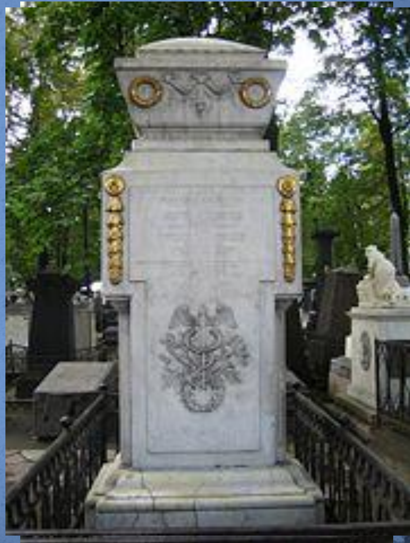
Могила М.В. Ломоносова

Ушёл из жизни М. В. Ломоносов в 1765г., он простудился и умер. Погребён на кладбище Александро- Невской лавры.