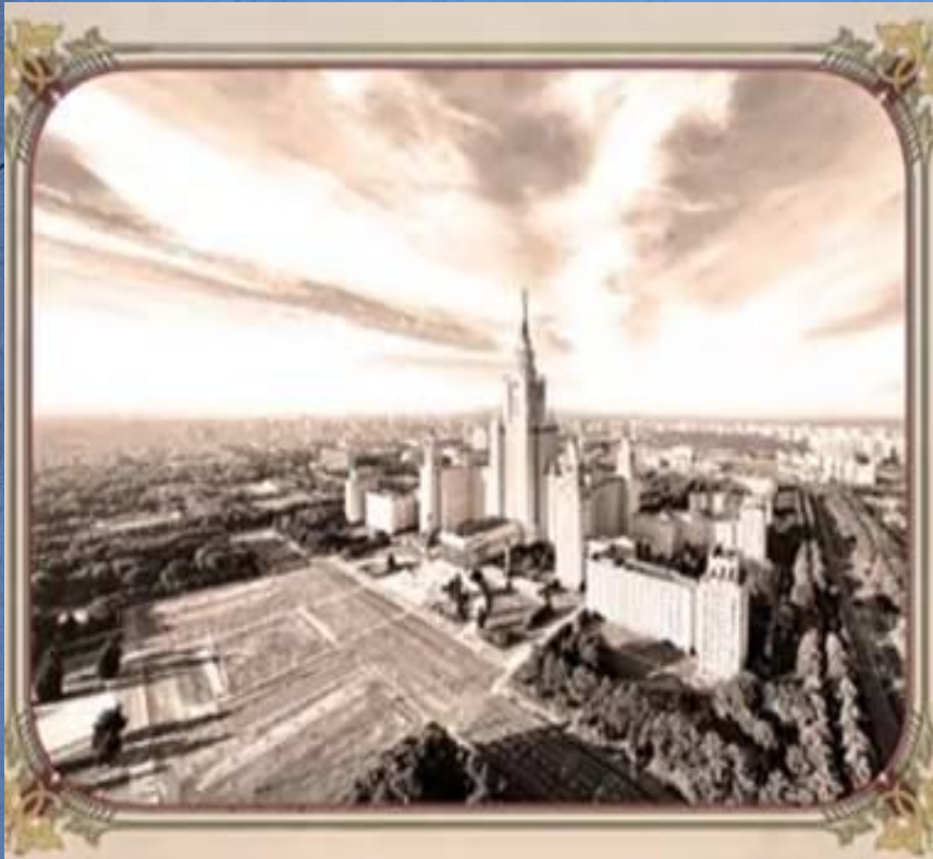
Вид на главное здание МГУ имени М.В. Ломоносова

В 1754 году разработал проект создания Московского университета. И через год, в 1755 году, в Москве открылся этот университет, который сейчас носит имя его создателя