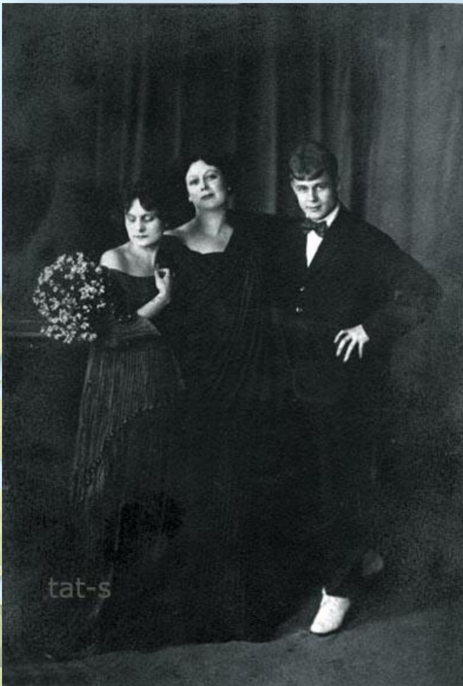
Приемная дочь Айседоры Ирма Дункан, Айседора Дункан, Сергей Есенин. Москва. Фото - май, 1922 год.