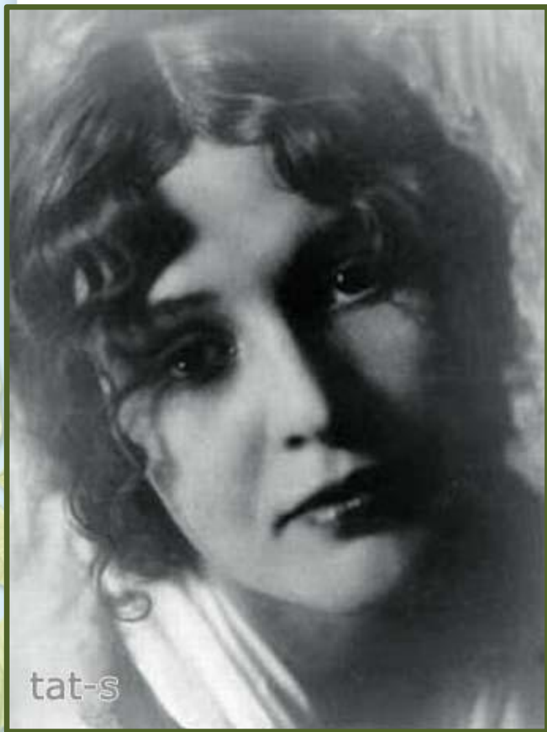
Жена Есенина, актриса - Зинаида Николаевна Райх (1894 - 1939)

30 июля 1917 года Есенин (21 год) обвенчался с актрисой Зинаидой Райх в церкви Кирика и Улиты Вологодского уезда.