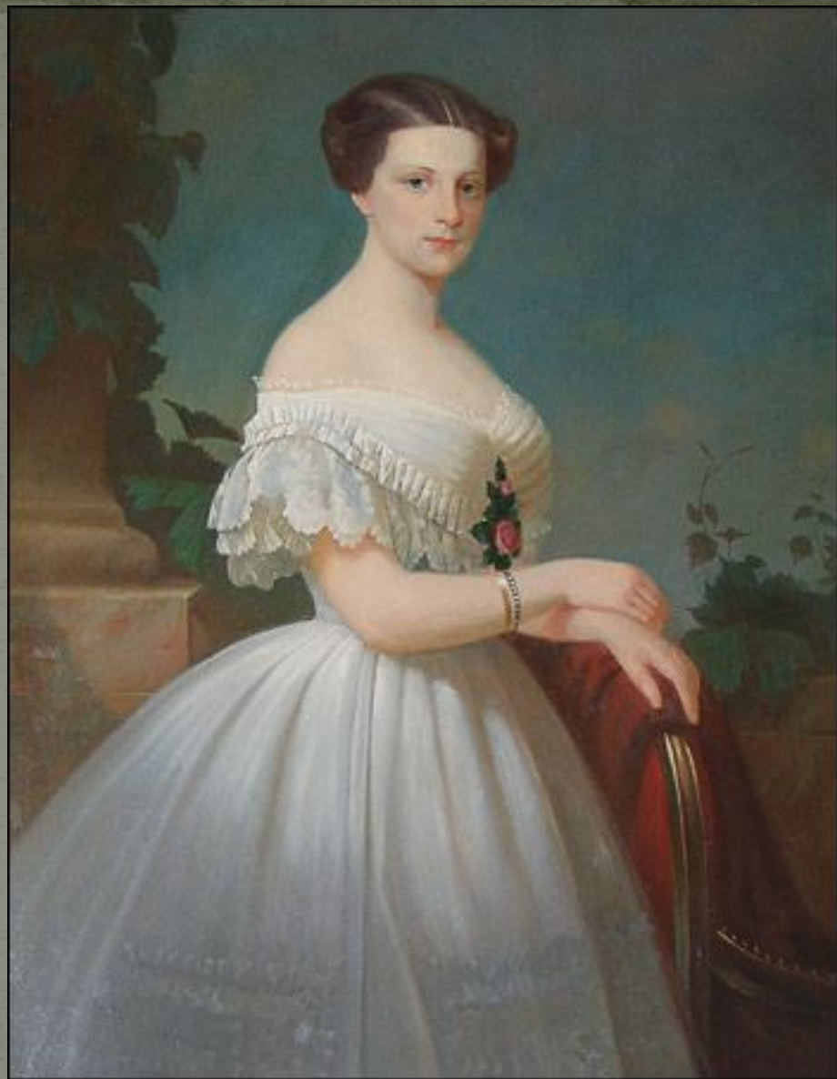
Портрет Амалии Адлерберг, 1865 год