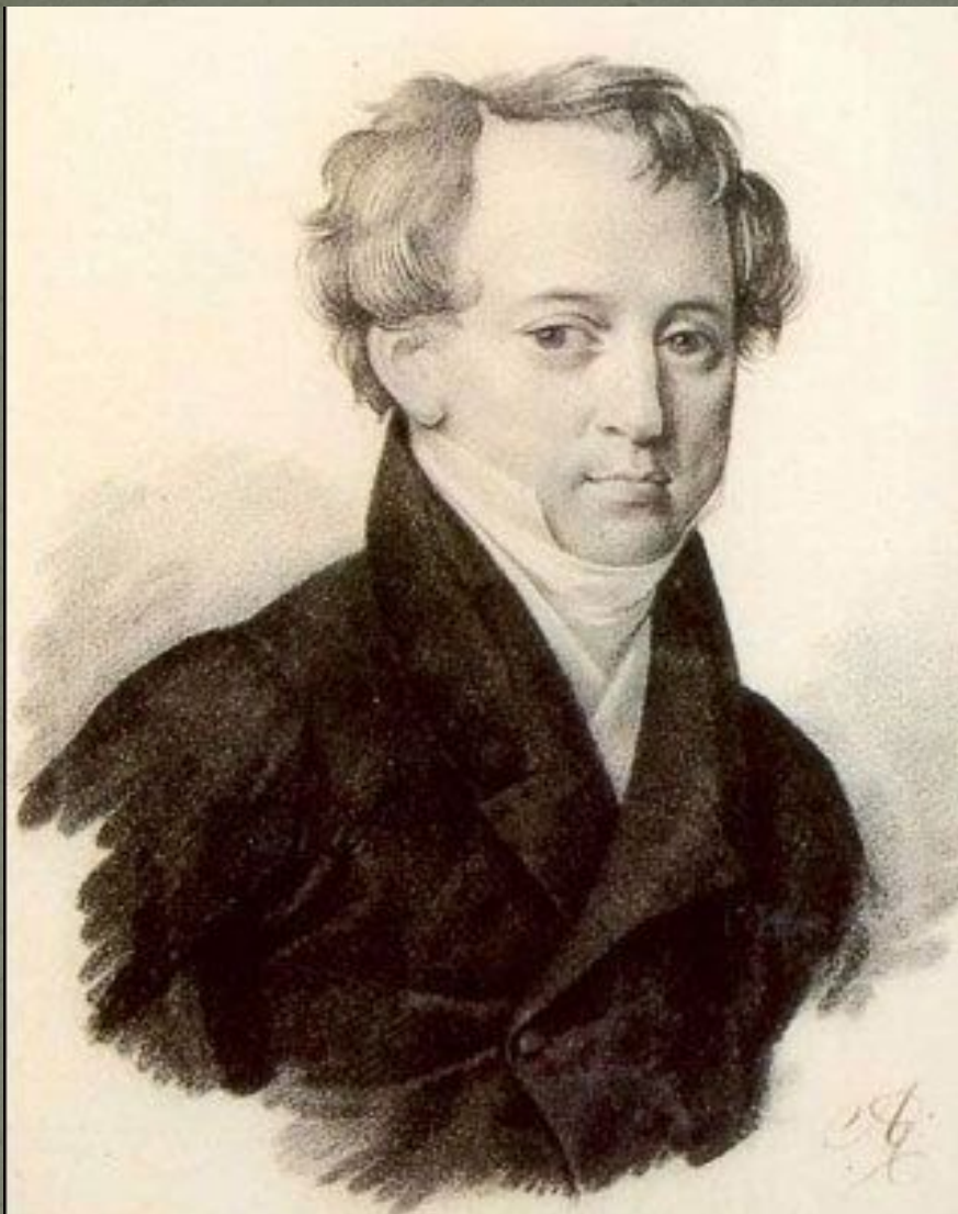
Ф.И. Тютчев, 1825г. Неизвестный художник