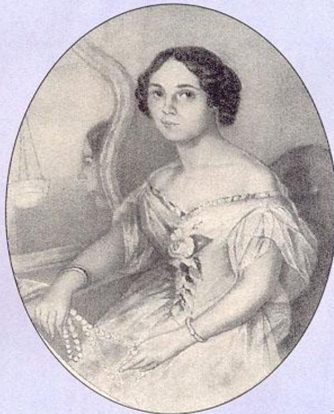
Елена Денисьева. Начало 1850-х гг.

Елена Денисьева – « роковая » любовь поэта.