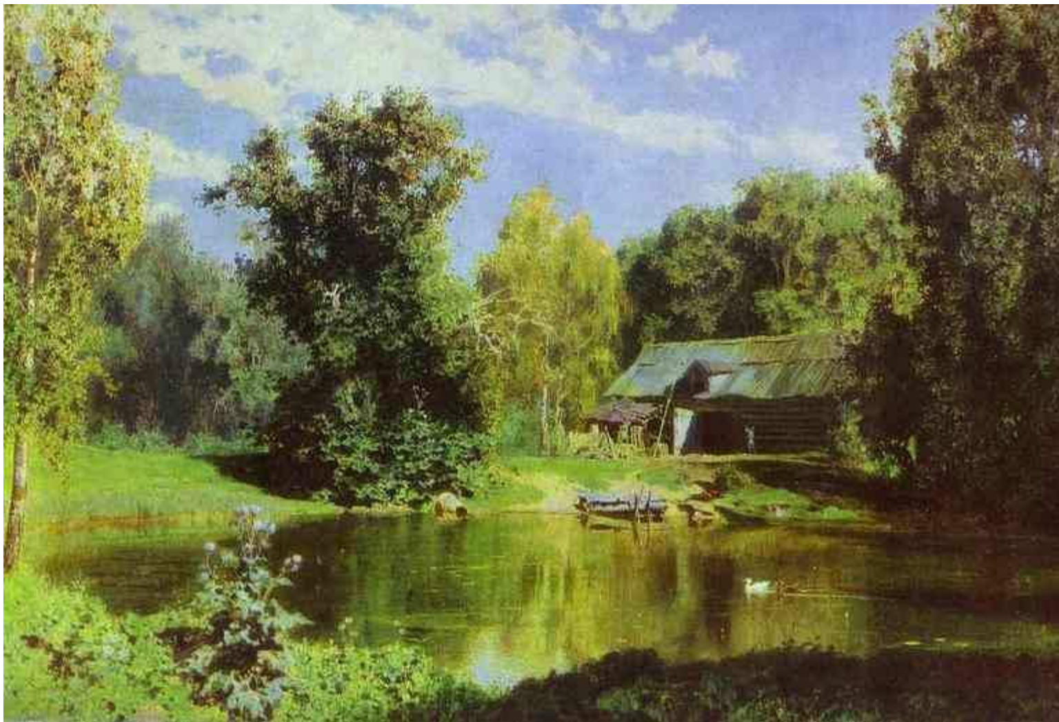
Вид на Абрамцево