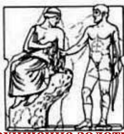
похищение золотых яблок Гесперид