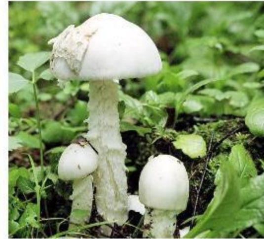
МУХОМОР БЕЛЫЙ ВОНЮЧИЙ