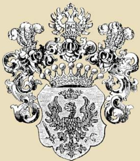
Герб графов Голенищевых-Кутузовых

Дворянский род Голенищевых-Кутузовых ведет своё происхождение от некоего Гавриила, поселившегося в Новгородских землях во времена Александра Невского (середина XIII века). Среди его потомков в XV веке был Федор по прозвищу Кутуз, чей племянник звался Василий по прозвищу Голенище. Сыновья его стали зваться Голенищевы-Кутузовы и состояли на царской службе. Дед М.И. Кутузова дослужился лишь до капитана, отец уже до генерал-поручика, а Михаил Илларионович заслужил потомственное княжеское достоинство.