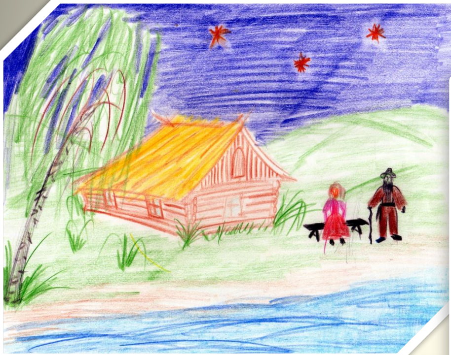
Рисунок Внуковой Дарьи

Я не скоро, не скоро вернусь! Долго петь и звенеть пурге. Стережет голубую Русь Старый клен на одной ноге.