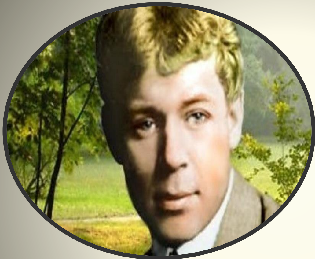
Сергей Александрович Есенин (1895-1925гг) –русский поэт

Родился в Рязанской губернии в крестьянской семье. Закончил Константиновское четырехклассное училище с отличием в 1909 г., продолжил обучение в Спас-Клепиковской учительской школе в 1909-1912 гг., из которой вышел «учителем школы грамоты». В 1914 году в детском журнале «Мирок» впервые были опубликованы стихотворения Есенина. В период 1923-1925 годов были созданы его лучшие стихотворения и поэмы. Умер в декабре 1925 года. Похоронен Сергей Есенин в Москве на Новодевичьем