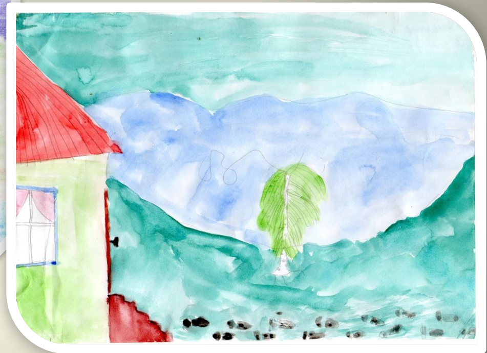
Рисунок Вольманова Виктора

Я не скоро, не скоро вернусь! Долго петь и звенеть пурге. Стережет голубую Русь Старый клен на одной ноге.