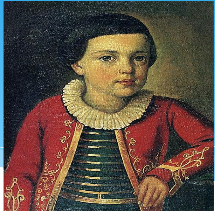
Поэт в возрасте 6-8 лет