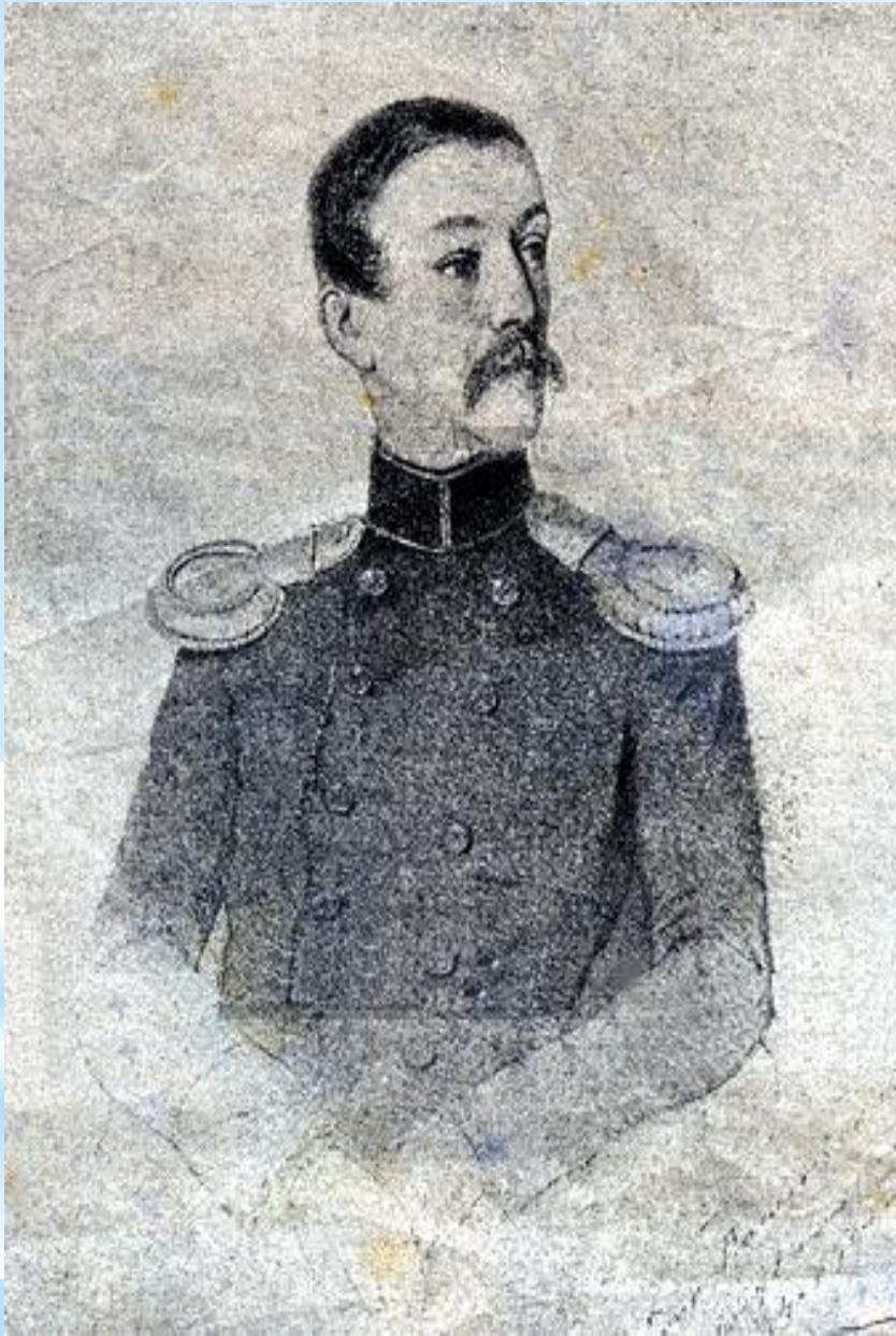
Н. С. Мартынов, убивший Лермонтова на дуэли