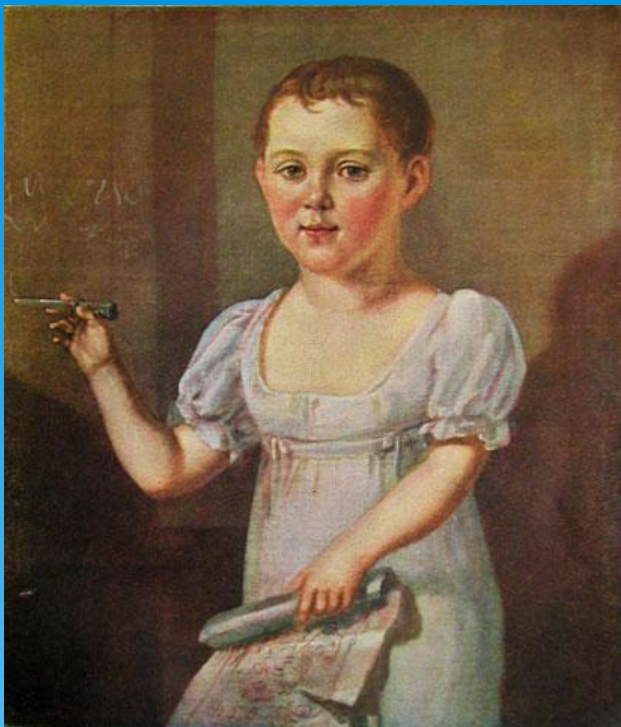
М. Ю. Лермонтов в возрасте 3-4 лет