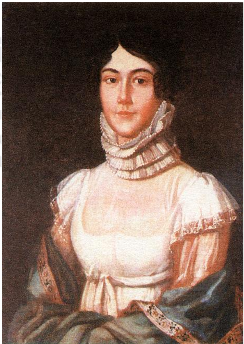
М. М. Лермонтова (1795—1817 гг.), мать М. Ю. Лермонтова