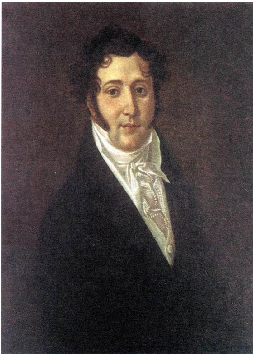
Ю. П. Лермонтов (1787—1831 гг.), отец поэта