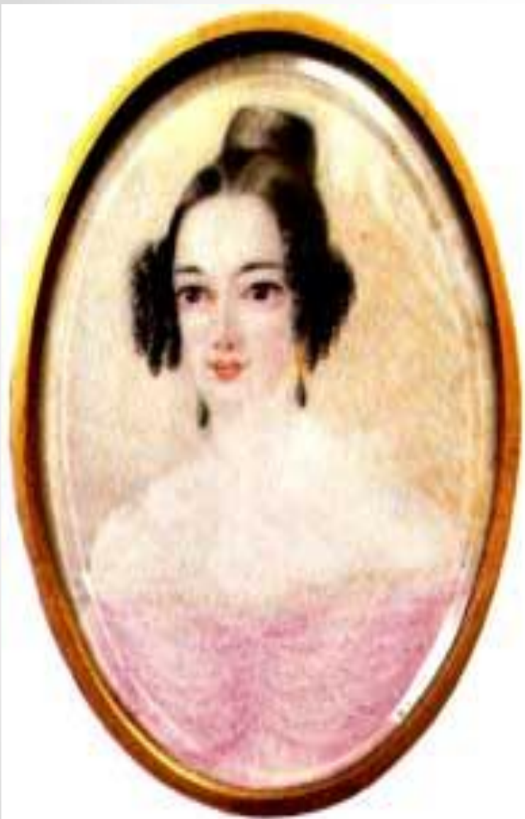
Екатерина Александровна Сушкова «Зови надежду сновиденьем...»