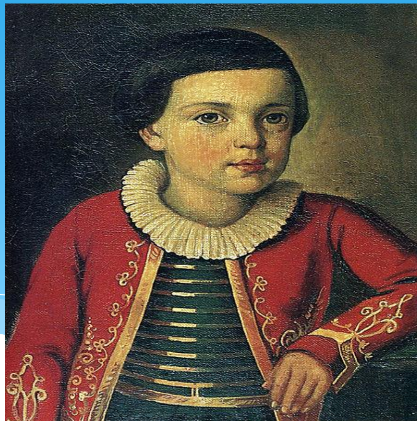
Поэт в возрасте 6-8 лет