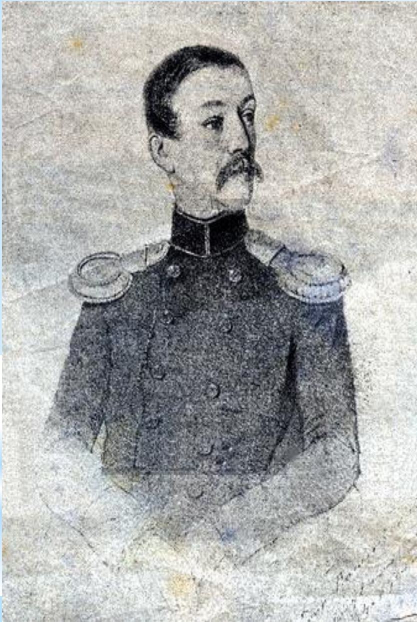
Н. С. Мартынов, убивший Лермонтова на дуэли