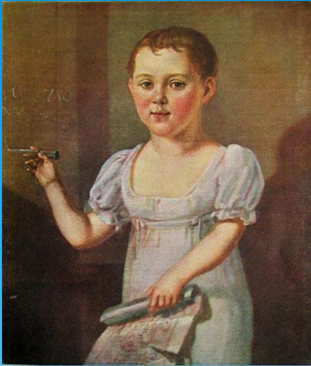
М. Ю. Лермонтов в возрасте 3-4 лет