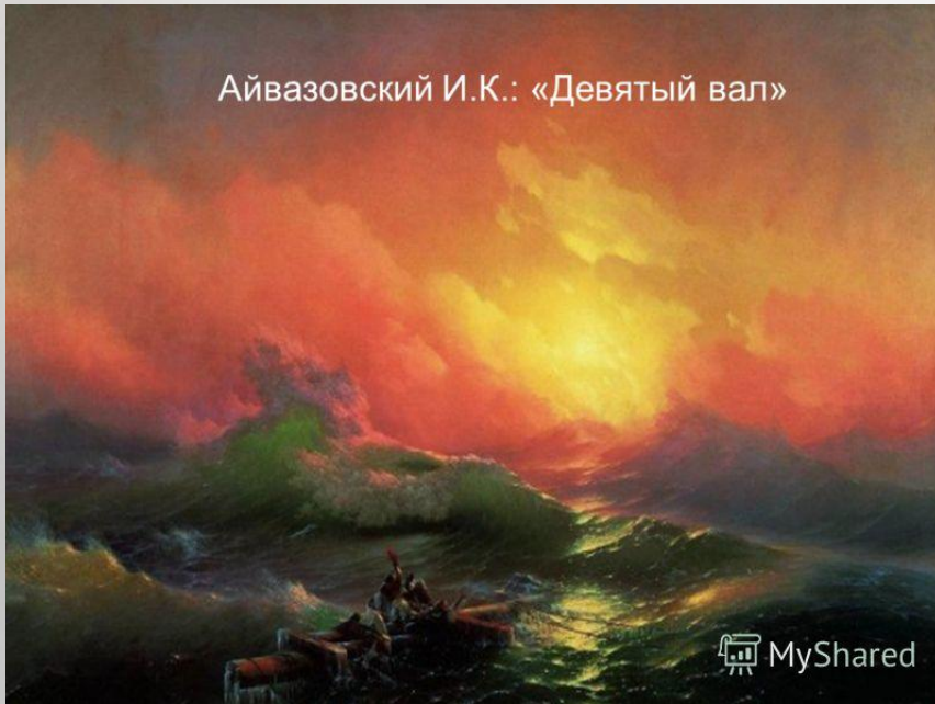
Айвазовский И.К.: «Девятый вал»