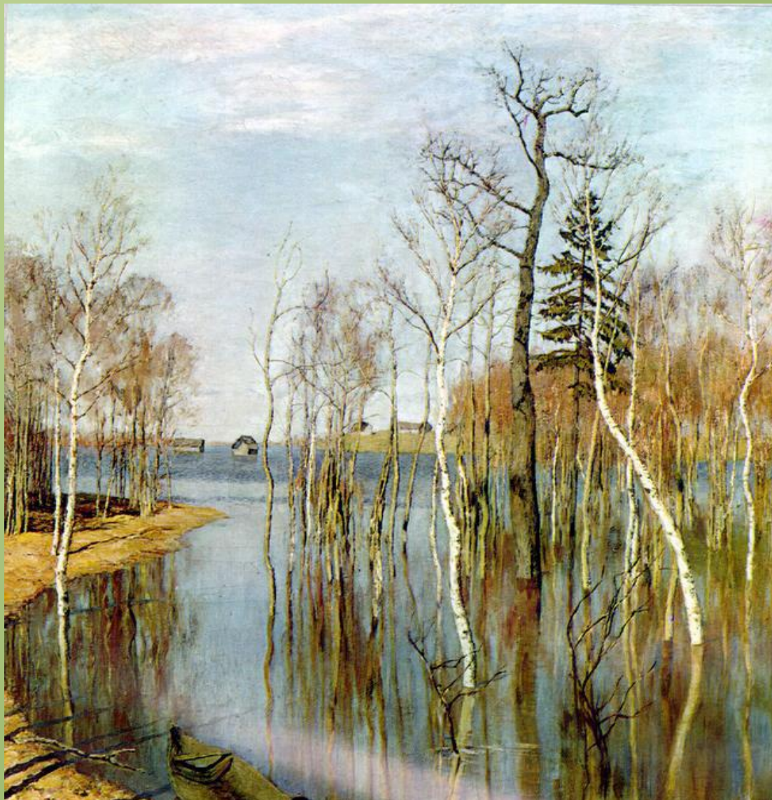
И.И. Левитан. «Весна. Большая вода»