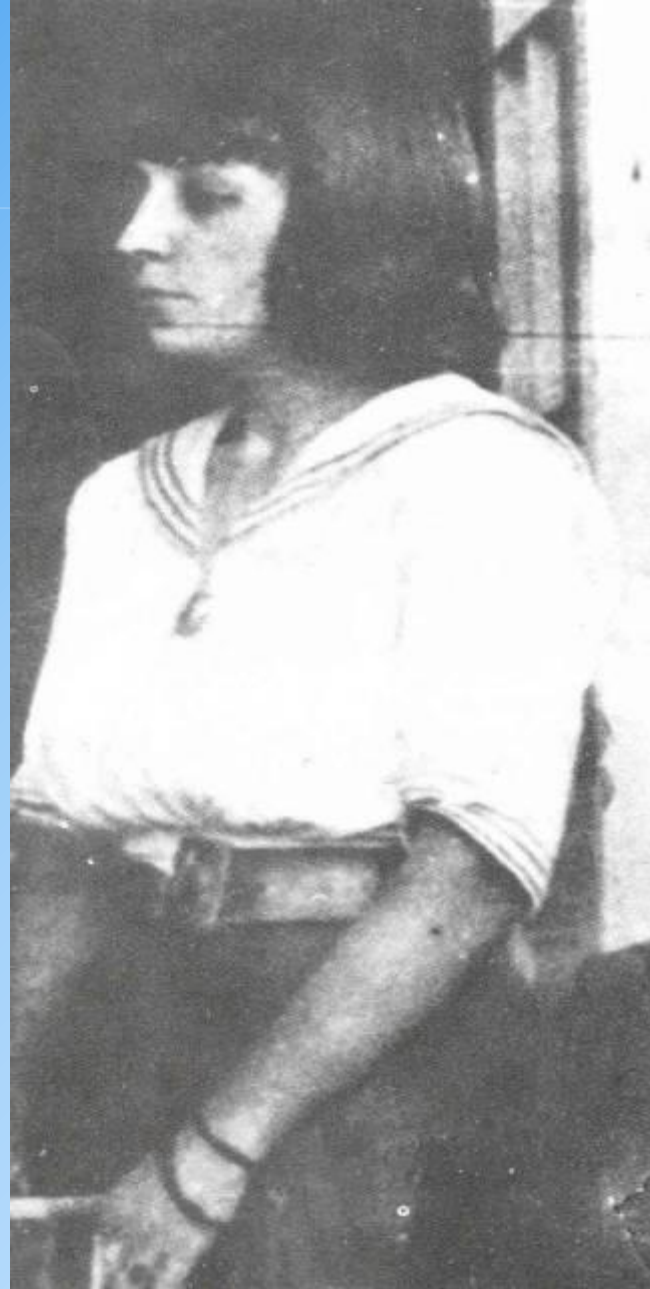
Марина Цветаева. Коктебель 1911 г.