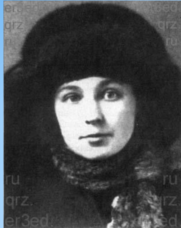
Марина Цветаева. Фото ок. 1917 года |

Марина Цветаева провела в России годы первой мировой войны и революции