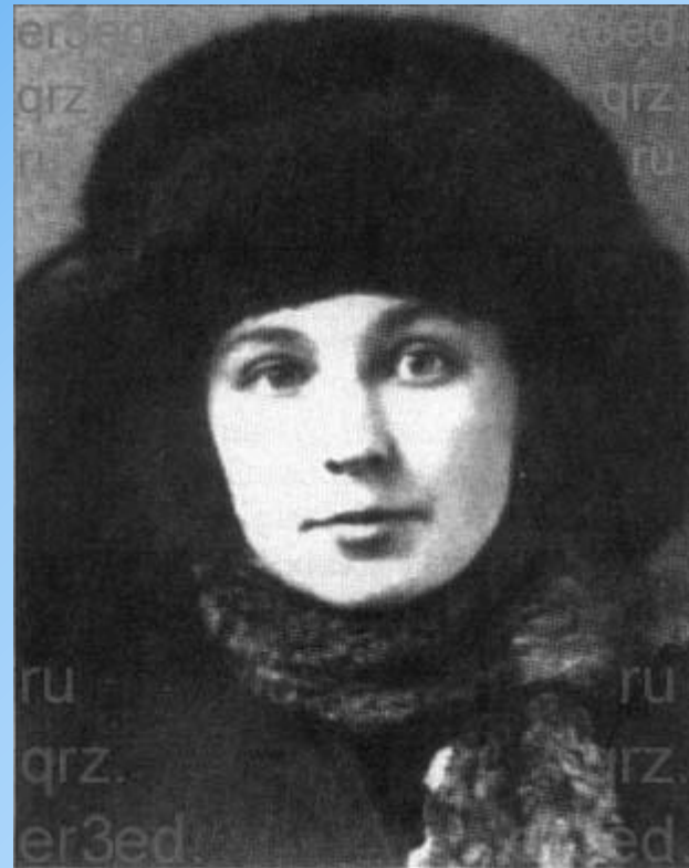
Марина Цветаева. Фото ок. 1917 года |

Марина Цветаева провела в России годы первой мировой войны и революции