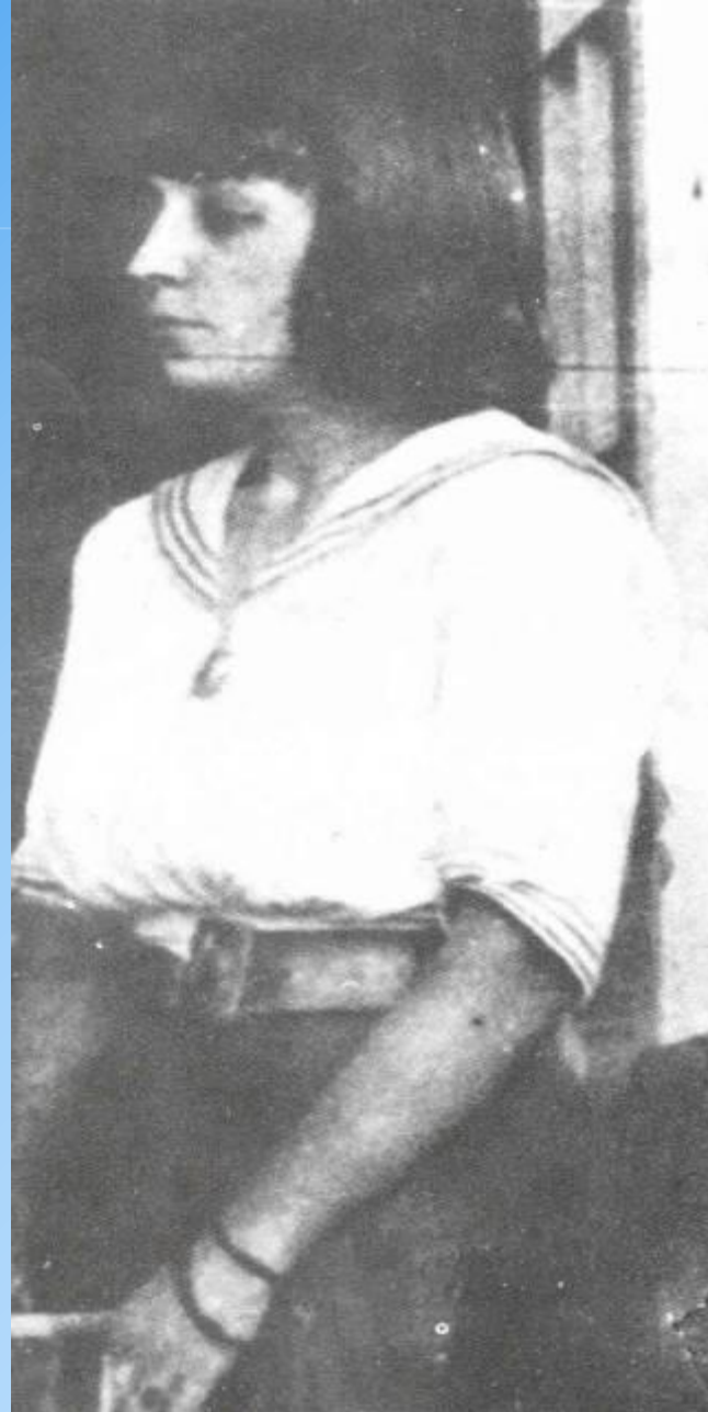
Марина Цветаева. Коктебель 1911 г.