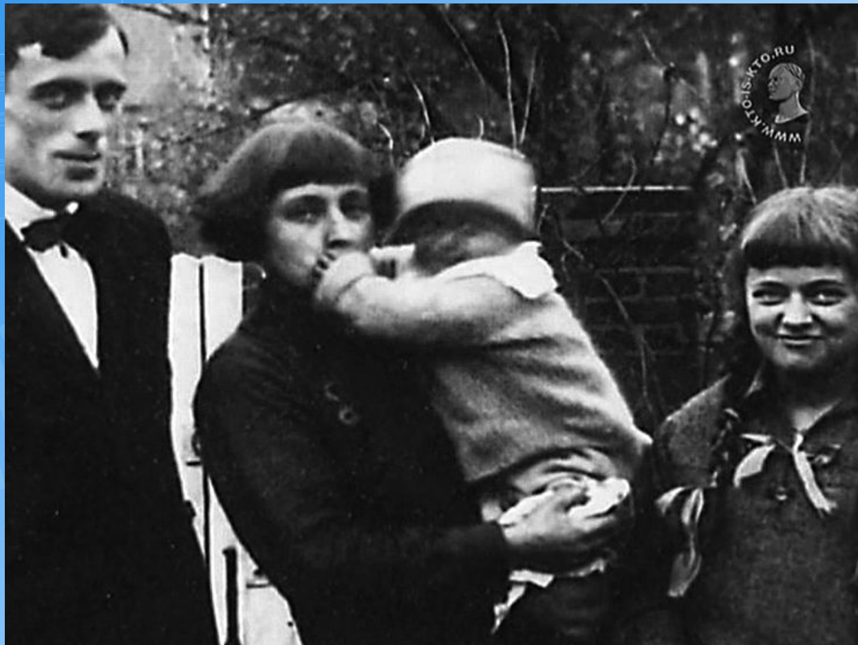
Марина Цветаева в Чехии, 1925