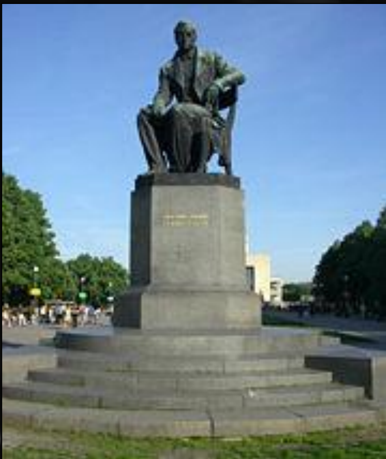
Памятник Грибоедову в Санкт-Петербурге (Пионерская площадь, возле ТЮЗа)