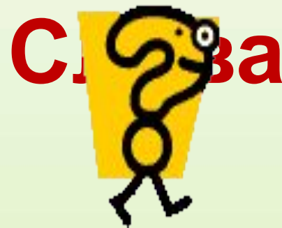
рис – рисунок