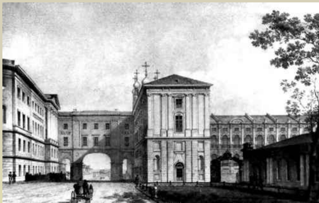
А.А.Тон Царское Село. Лицей. 1822.