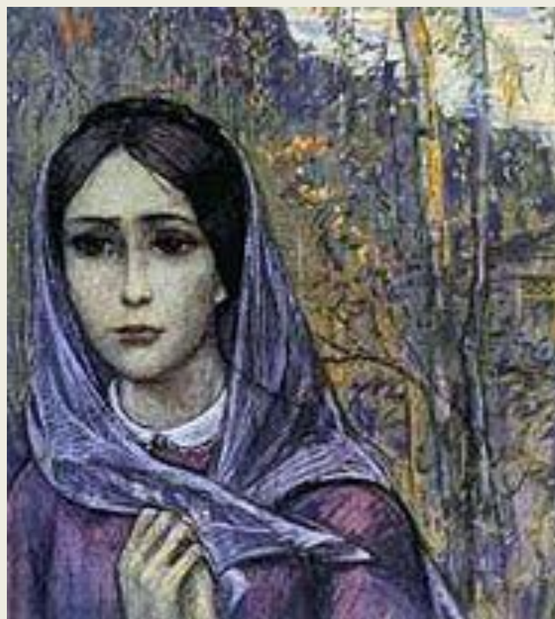
И.С. Глазунов. Иллюстрация к роману И.А. Гончарова «Обрыв».