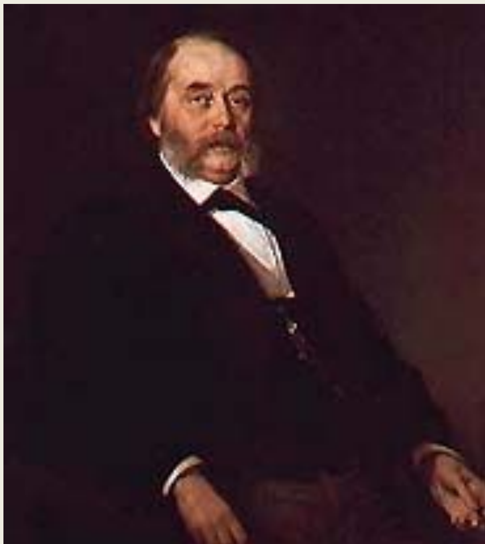
И. А. Гончаров. Портрет работы И. Н. Крамского. 1874 г.