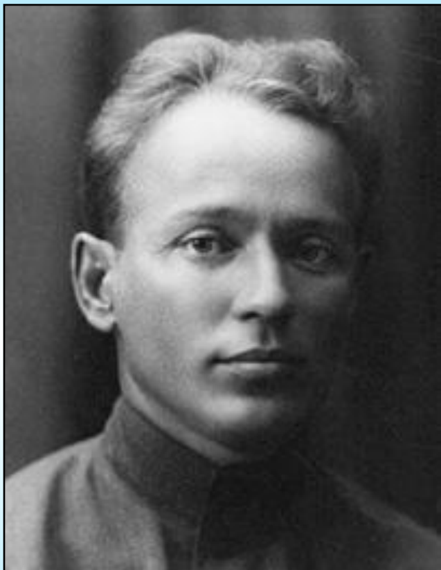
Михаил Шолохов в юношеские годы