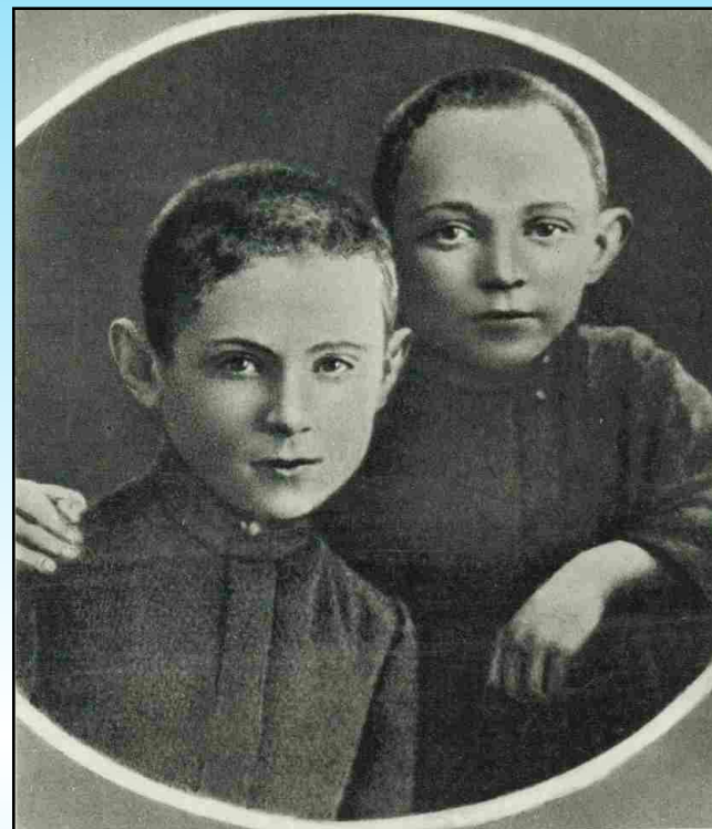
Михаил Шолохов (справа)- ученик 1-го класса мужской гимназии