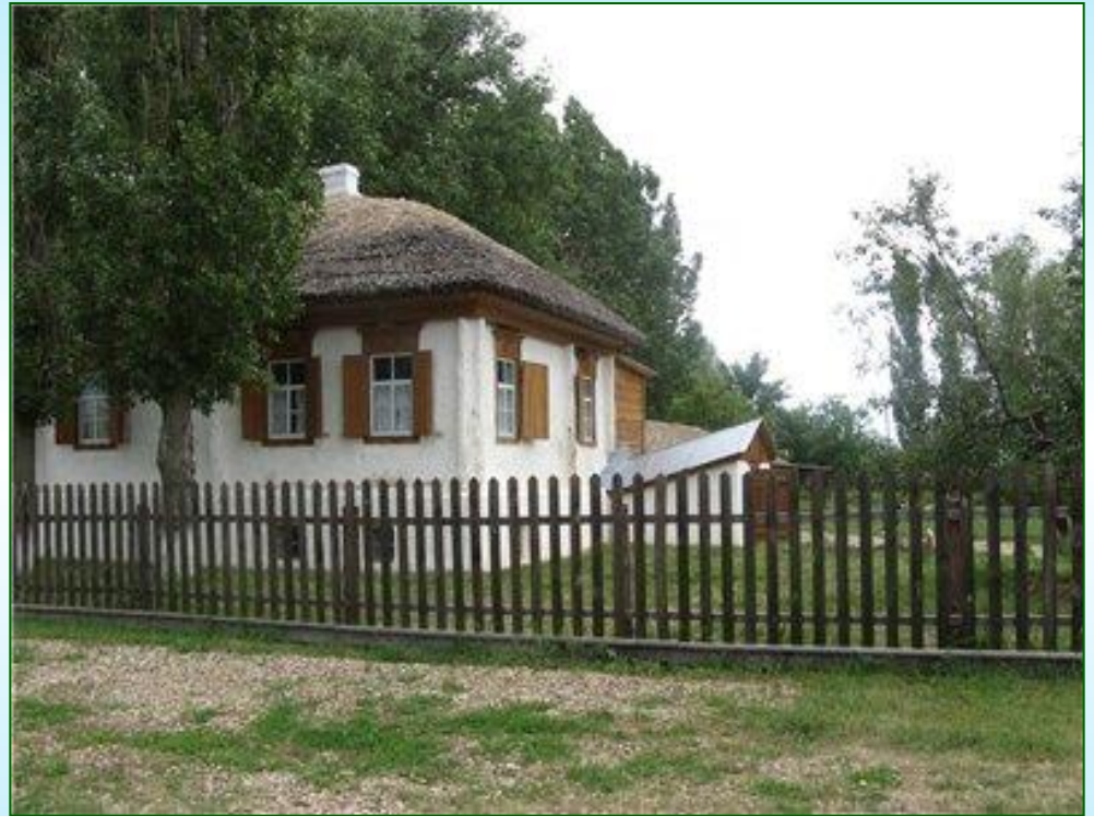
Хутор Кружилин, станица Вешенская

Среди шести материков В краю, где плещет Дон, Стоит на стыке двух веков Соломой крытый дом. Я низко кланяюсь ему, Не постучав в окно. Другие люди в том дому Живут давным-давно Но та же в окнах синева. И так же помнит дом того, Кто первые слова Здесь начинал с трудом.