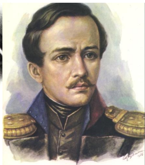
Михаил Юрьевич Лермонтов (1814—1841)