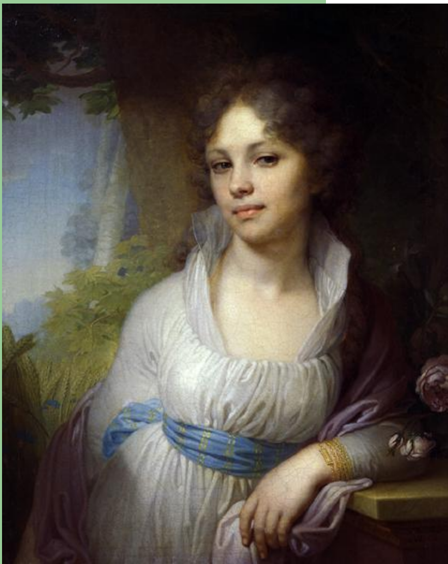
В. Боровиковский. Портрет Лопухиной