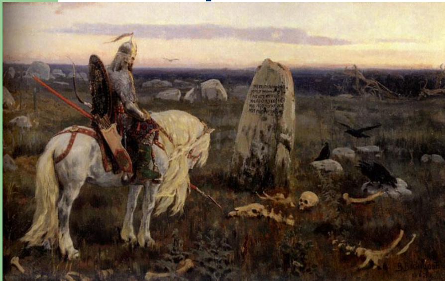
Васнецов. Витязь на распутье