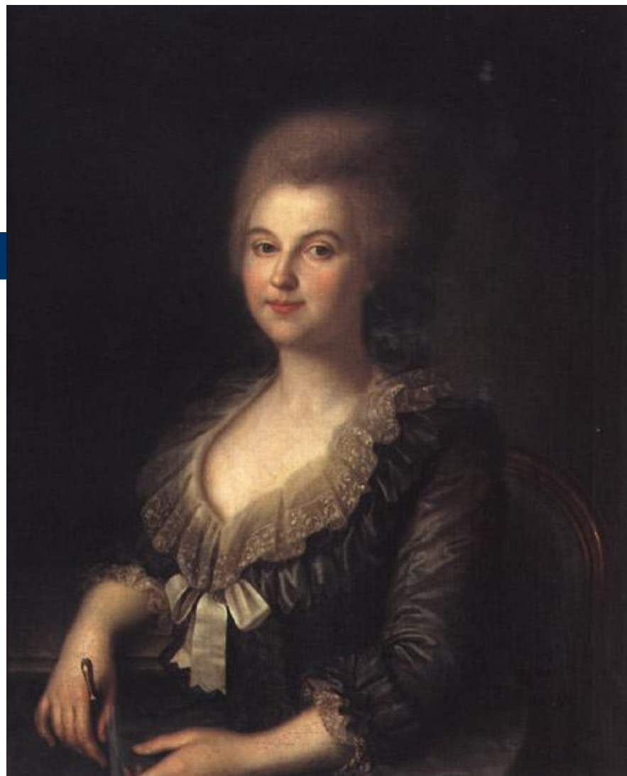
И. Аргунов. Портрет Ветошниковой