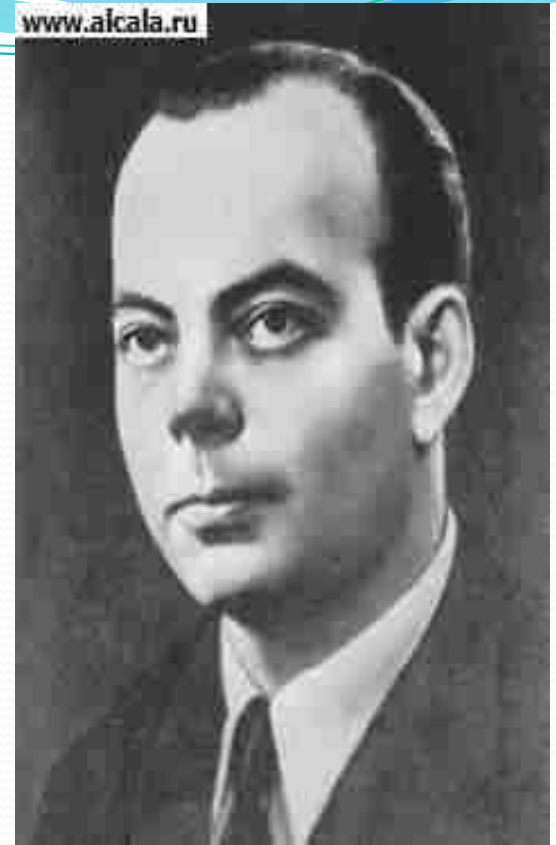
Антуан де Сент - Экзюпери.